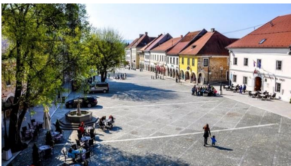
Figure 7 GLAVNI TRG