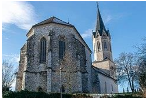
Slika 6 STOLNICA SV. NIKOLAJA