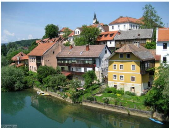
Slika 5 BREG