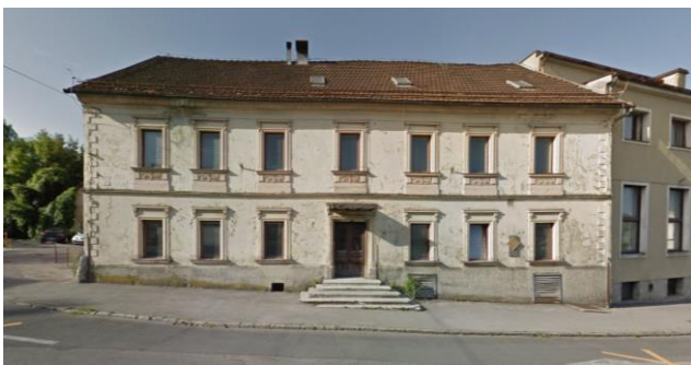
Slika 3 HIŠA NOVOMEŠKE POMLADI