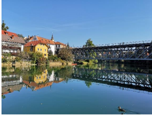
Slika 2 KANDIJSKI MOST