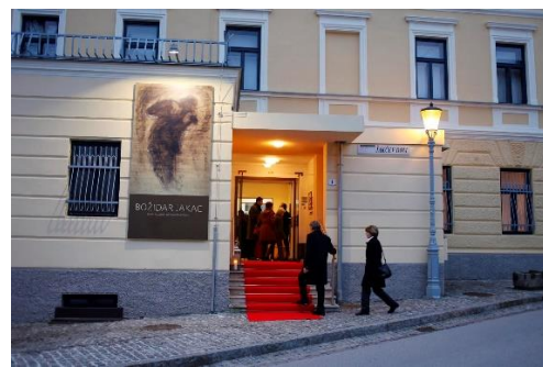
Slika 4 JAKČEV DOM