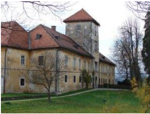
Slika 1 GRAD GRM