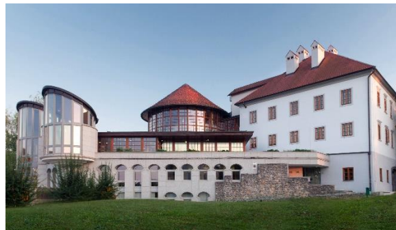
Figure 8 KNJIŽNICA MIRANA JARCA