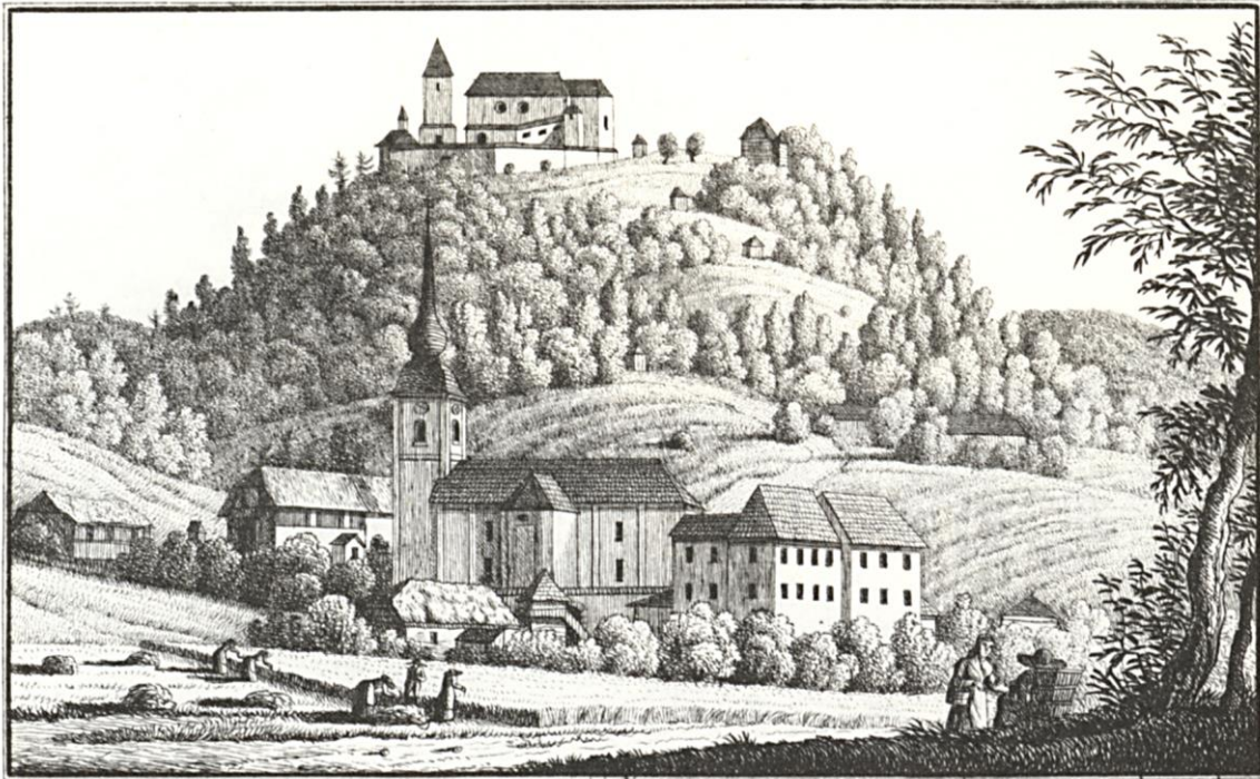
Slika 2: Zgodovinski razvoj