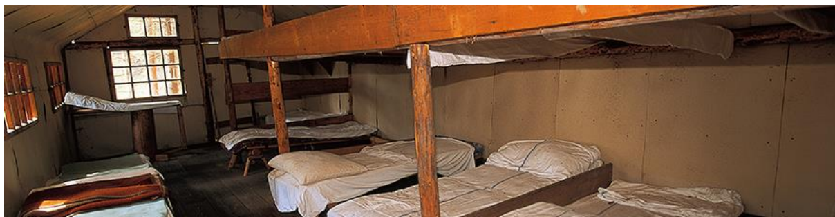
Slika 8: Paučkove partizanske bolnišnice

( https://www.slovenjgradec.si/O-mestu/Znamenitosti/Pau%C4%8Dkove-partizanske-bolni%C5%A1nice )