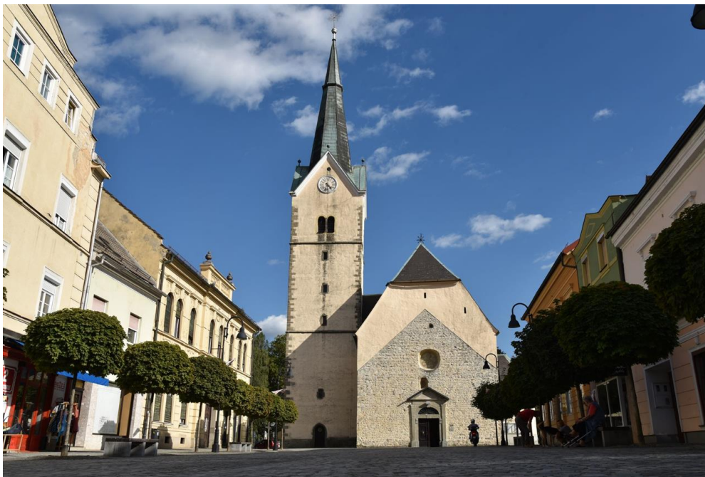
Slika 5 : Cerkev sv. Elizabete

Kdo ve ali je v vsem tem kaj resnice, zagotovo pa so legende pomemben del nesnovne kulturne dediščine in izrednega pomena za ohranjanje lokalne identitete. Slovenj Gradec ima ogromno kulturnih kot tudi naravnih znamenitosti, ena izmed znamenitosti je Cerkev sv. Elizabete . Je slovenjgraška župnijska cerkev. Je ena najstarejših cerkva posvečenih Elizabeti Ogrski. Leta 1251 jo je posvetil oglejski patriarh Bertold Andeški, stric Elizabete Ogrske. Sestavljajo jo gotska zakristija, kapela, zvonik na severni strani, dve baročni kapeli na južni strani, romanska pravokotna ladja in prezbiterij. Kvalitetna baročna oprema v notranjosti, sodi v sam vrh baročnega kiparstva v slovenskem prostoru. Glavni oltar iz leta 1731/1734 je zasnoval graški kipar Janez Jakob Schoy (1686–1733), izdelal pa, kot je zapisano na hrbtni strani, mizar Nidermar (morda Nieder–mayer). Osrednji prostor zavzema slika sv. Elizabete med berači, mojstrsko delo slovenjgraškega slikarja Franca Mihaela Straussa (1674–1740), iz leta 1732. Stranska oltarja in prižnicoje z odličnim kiparskim okrasjemv letih 1770–1773 izdelal slovenjgraški meščan, iz Rogatca priseljeni kipar in rezbar, Janez Jurij Mersi (1725–1788). Oltarni sliki za slavoločni – levi stranski oltar ter nekdanji oltar v severni Anini kapeli sta delo Janeza Andreja Straussa (1721–1783). Podobo Zaroke sv. Katarine je leta 1638 naslikal Mihael Skobl, ugledni meščan in mestni sodnik. ( https://www.kpm.si/dokumenti/kpmsg/02-ELIZABETA.html )