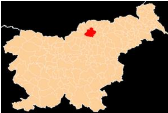
Slika 1: Lega Slovenj Gradca

( https://sl.wikipedia.org/wiki/Slovenj_Gradec , https://dijaski.net/gradivo/geo_ref_slovenj_gradec_01 )