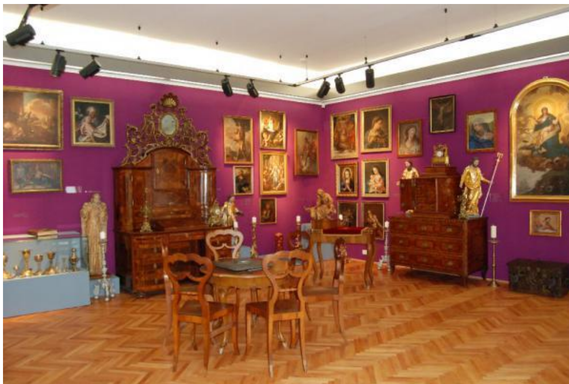
Slika 6 : Sokličev muzej

Sokličev muzej je muzej Jakoba Sokliča, duhovnika, kulturnega delavca in zbiralca, ki je bil rojen 7. maja 1893 v vasi Ribno pri Bledu. Jakob Soklič je v skoraj štiridesetletnem delovanju opravil nadvse pomembno nalogo varuha premične kulturne dediščine, zato ga smatramo kot prvega muzealca v Slovenj Gradcu. Umrl je 21. decembra 1972 v slovenjgraški bolnici. Sokličeva zbirka obsega preko 1800 predmetov, od tega arheološke, etnološke, kulturnozgodovinske in zgodovinske predmete, numizmatično zbirko, likovno zbirko starejše umetnosti in zbirko sodobne likovne umetnosti 20. stoletja, zbirko predmetov JV Azije, afriško zbirko in kotichek Huga Wolfa. V sklopu Sokličeve zbirke je razstavljena tudi knjižnica, ki jo je Jakob Soklič podedoval od Franca Ksaverja Meška ob njegovi smrti leta 1964 in vsebuje preko 6000 knjižnih enot. ( https://www.kpm.si/razstave/jakob-soklic-1893-1972-in-soklicева-zbirka/ )