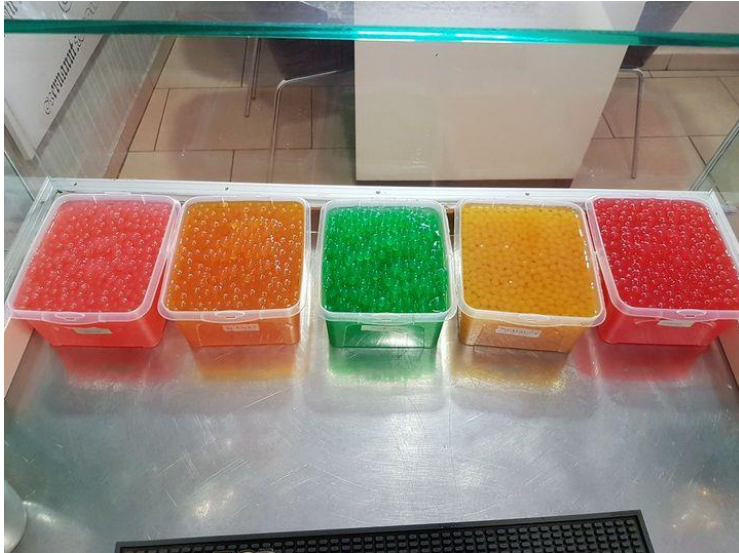
Slika 3 : Bubble tea