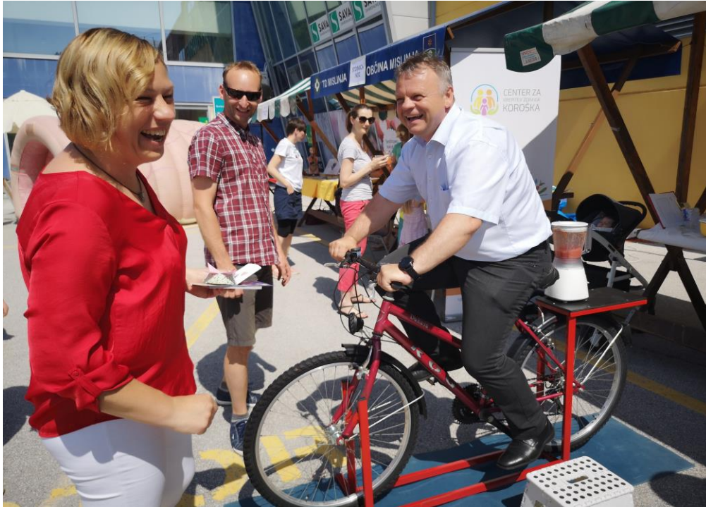
Slika 4 : Kolo s smoothijem