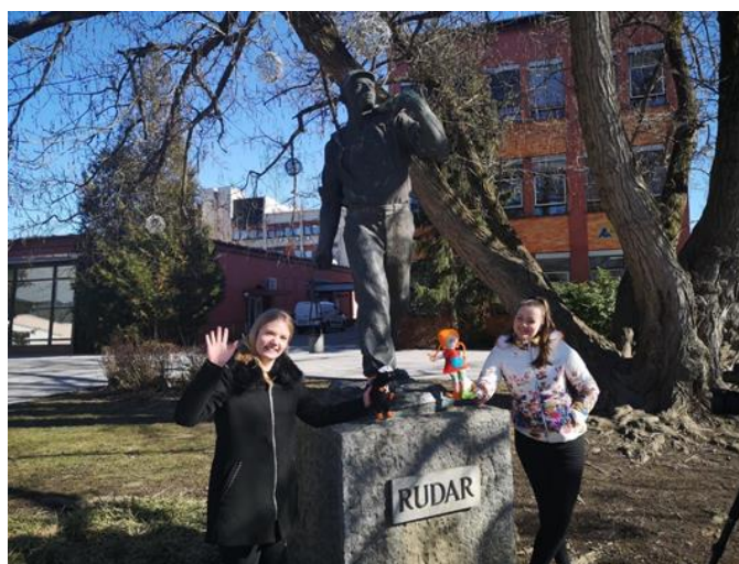
Slika 7: Utrinki iz snemanja promocijskega videa z lutkami