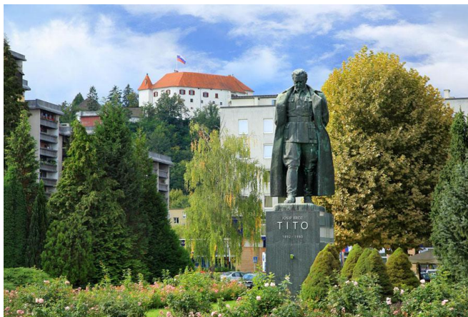
Slika 5: Titov spomenik

https://slike.td-sencur.si/picture.php?/7189