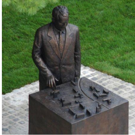
Slika 1: Nestl Žgank

https://www.velenje.si/za-obiskovalce/naravna-in-kulturna-dediscina/10874