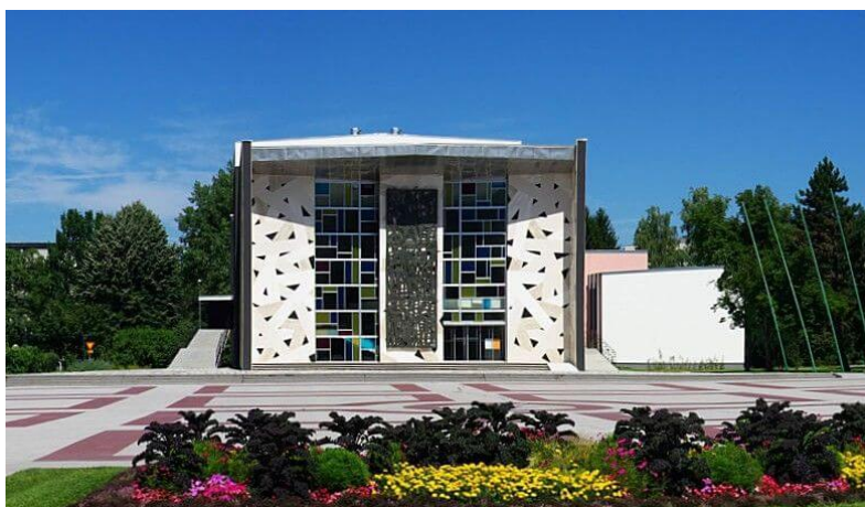
Slika 4: Kulturni dom Velenje

https://www.velenje.si/za-obiskovalce/naravna-in-kulturna-dediscina/10874