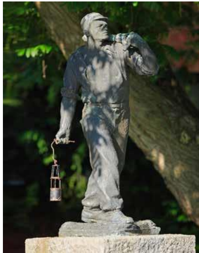
Slika 2: Rudar

https://www.velenje.si/za-obiskovalce/naravna-in-kulturna-dediscina/10874