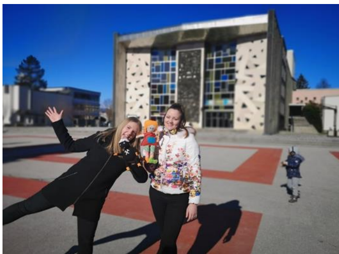
Slika 6: Utrinki iz snemanja promocijskega videa z lutkami

https://slike.td-sencur.si/picture.php?/7189