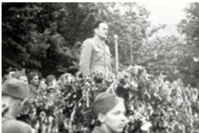
Slika 19: https://www.ajdovscina.si/ajdovscina/zgodovina/prelomni_dogodki

Prvo slovensko vlado je sestavil in vodil Boris Kidrič. Imela je 10 ministrov in eno ministrico. Ustanovljena je bila v Bratinovi dvorani, ki je bila v sedemdesetih letih prejšnjega stoletja prenovljena, v letu 2005 pa tudi preimenovana v Dvorano prve slovenske vlade.