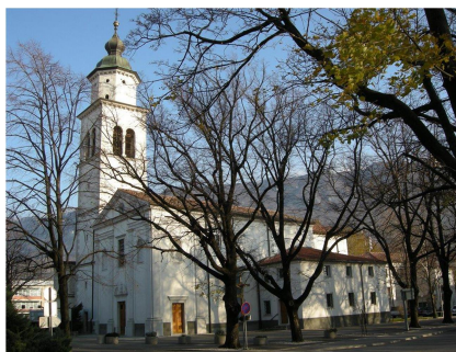
Slika 23