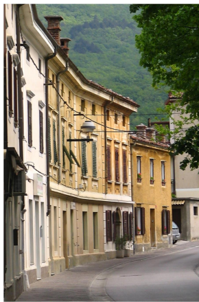
Slika 18: https://www.vipavskadolina.si/odkrivaj/dediscina/kulturna-dediscina/arhitektura

Na vzhodni strani Hublja je mestni predel Šturje, nekdanja samostojna občina, kjer je cerkev svetega Jurija. To je predvsem stanovanjski predel, gostota poselitve je največja v soseski Ribnik, kjer stoji tudi Osnovna šola Šturje Ajdovščina.