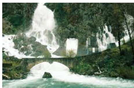
Slika 11: https://aktivni.metropolitan.si/dobro-pocutje/potovanja/ajdovscina/