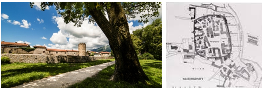
Slika 6: https://www.vipavskadolina.si/splosno/ajdovscina

Ajdovščina je eno najbolj raziskanih rimskih območij v Vipavski dolini. Najbrž tudi zato, ker je med vsemi slovenskimi kraji, ki so jih naseljevali Rimljani, le še v Ajdovščini ohranjeno skoraj povsem strnjeno rimskodobno obzidje s štirinajstimi stolpi. Rimljani so utrjen vojaški tabor, ki je bil vključen v obrambni sistem vzhodnih meja rimskega cesarstva, začeli graditi okoli leta 270. Ajdovščina se je dolga stoletja razvijala izključno znotraj njega. Od tedanje utrdbe je bolj ali manj ohranjenih 7 stolpov in del obzidja.