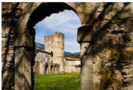
Slika 8: https://www.vipavskadolina.si/odkrivaj/dediscina/kulturna-dediscina/arheoloska-dediscina

Utrdba ima tloris v obliki nepravilnega mnogokotnika. Notranjost utrdbe je zaradi kasnejših prezidav, rušenj in novejših pozidav slabo poznana. Odkrili pa so ostanke več stavb, term in kanalizacije. Forum je bil verjetno na mestu današnjega glavnega mestnega trga.