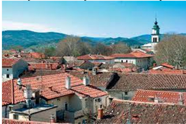
Slika 4: http://www.ung.si/sl/studij/studentski-vodnik/ajdovscina/

Zanimiva posebnost Ajdovščine je ta, da je mesto postalo ob koncu druge svetovne vojne za nekaj dni prestolnica Slovenije, v središču mesta pa je tako nastal spomenik prvi povojni vladi na Slovenskem, ustanovljeni 5. maja 1945, ki velja tudi za občinski praznik.