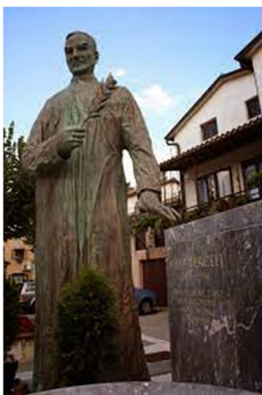
Slika 24: https://ars.rtvsllo.si/2020/03/musica-sacra-223/