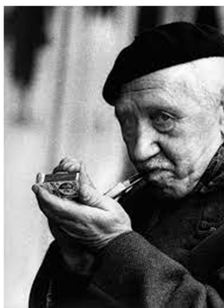
Slika 22: https://en.wikipedia.org/wiki/Veno_Pilon

Veno Pilon se je rodil 22. septembra 1896 kot Venceslav Pilon, »v gasi pod kolono« v Ajdovščini. Ob očetu Domenicu in materi Urški, je odrasčal z bratom Jožefom ter s sestrami Marijo, Alojzijo, Milko in Justo. Učitelj na ajdovski ljudski šoli je opazil Pilonovo likovno nadarjenost in njegovi materi priporočil, naj nadaljuje šolanje v Gorici. V aprilu 1915 je bil Veno Pilon mobiliziran v avstro-ogrsko vojsko.