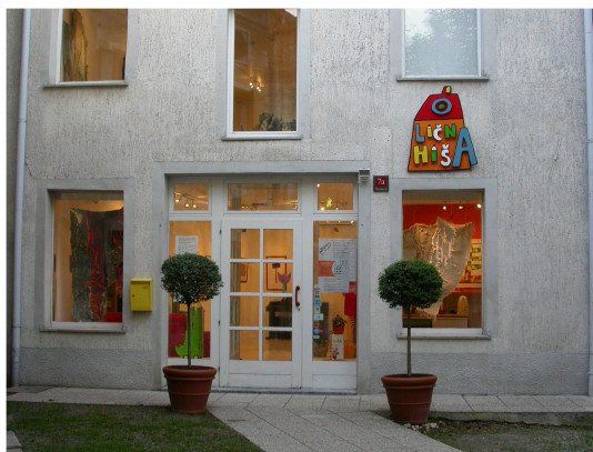
Slika 27: https://www.vipavskadolina.si/odkrivaj/dediscina/kulturna-dediscina/muzeji-in-galerije/galerija-licna-hisa-ajdovscina