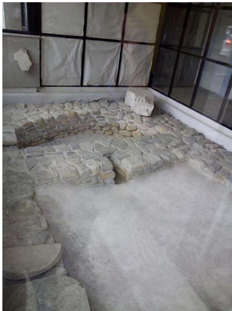
Slika 10: https://www.travel-slovenia.si/slo/location/rimske-terme-v-ajdovscini/

Kako velik pomen na higieno in zdravje so Rimljani pripisovali kopališčem, potrjujejo tudi manjše rimske terme, ki so jih zgradili v Ajdovščini. Ostanke kopališča se nahajajo v južnem delu mesta, na območju današnje tržnice. Kopališča so služila tudi kot družbena zbirališča.