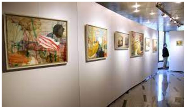
Slika 25: https://www.vipavskadolina.si/odkrivaj/dediscina/kulturna-dediscina/muzeji-in-galerije/lokarjeva-galerija-ajdovscina

V Ajdovščini, v rojstni hiši Danila Lokarja, zdravnika in pisatelja, pod okriljem Društva likovnih umetnikov Severne Primorske deluje Lokarjeva galerija. V galeriji so na ogled razstave sodobnih likovnih ustvarjalcev, v hiši pa je urejena tudi Lokarjeva spominska soba.