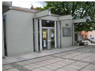
Slika 20: https://www.ajdovscina.si/katalog_informacij_javnega_znacaja/postopki_in_obrazci