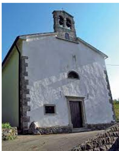
Slika 15:

Znotraj je zelo zanimiv strop iz ogledal, obogaten z mavčnim okvirjem. Glavni ter oba stranska oltarja sta iz 18. stoletja. Glavni oltar se ponaša z zelo raznoliko sliko. Nad oltarnim portalom stojita kipa sv. Antona Padovanskega in sv. Janeza Nepomuka. Oltarne slike so iz 19. stoletja. Cerkev je bila prenovljena leta 1990.