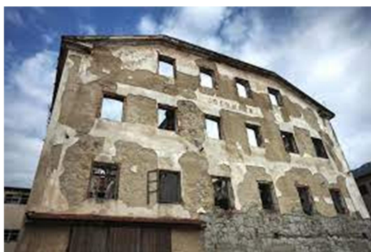
Slika 16 in 17: https://www.vipavskadolina.si/odkrivaj/dediscina/kulturna-dediscina/industrijska-dediscina