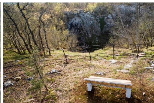
Slika 6: Živi muzej Krasa