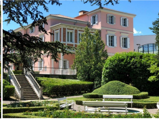
Slika 4: Botanični vrt Sežana