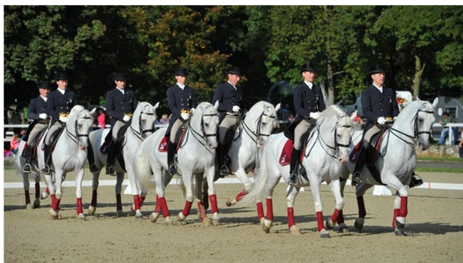
Slika 8: predstava Lipincev

Dijaki si bodo v Lipici najprej ogledali predstavo lipiške jahalne šole. Uživali bodo v predstavi polni glasbe, skladnosti in elegance v gibanju sredi opojne kraške krajine. Lipiški jahalni mojstri jim bodo v predstavi prikazali vse elemente, ki odlikujejo lipiško šolo jahanja. Capriole, levade, velika kvadirilja in drugi zahtevni elementi, ki so jim kos le najboljši Lipicanci. Ta bo trajala 55 minut v pokriti jahalnici. Nato bodo imeli voden dvourni ogled po najstarejšem hlevu Velbanca, sprehodili se bodo po stoletnih drevoredih, si ogledali Muzej Lipikum in Muzej kočij ter si ogledali Galerijo Avgusta Černigoja.