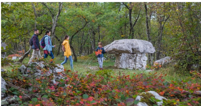
Slika 5: kamnita goba

Do muzeja bodo potrebovali približno 15 minut hoje, tam pa jih bo dočakal naslednji vodič, ki jih bo v dveh urah popeljal po poti ob kateri bodo lahko videli razne znamenitosti kot so Štirne, pastirske hiške, škrapljišča, naravna forma viva, kamniti gobi, smodnišnice, Golokratno jamo in Napoleonov hrast. Za obisk Živega muzeja Krasa bi vsak dijak odštél približno 5,00 EUR.