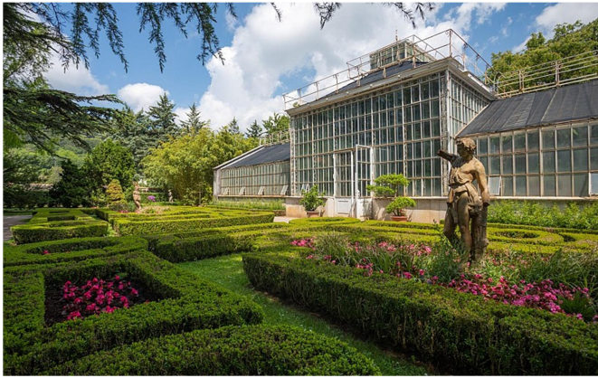
Slika 3: Botanični vrt Sežana