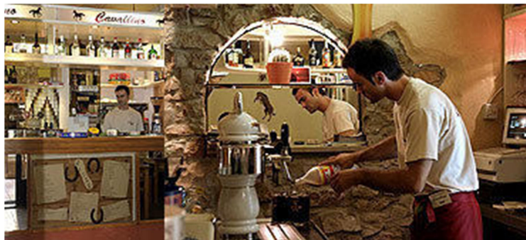
Slika 7: pizzerija Cavallino

Po potepanju po prečudovitem zunanjem muzeju, se bo skupina dijakov vrnila nazaj v središče mesta na kosilo. Kosili bodo v pizzeriji Cavallino, kjer bodo za samo 7,00 EUR pojedli gobovo juho, purana na žaru z njoki v sirovi omaki ali file brancina z blitvo in krompirjem ter solato. Za kosilo bodo imeli na voljo eno uro in pol, nato pa se bodo odpravili naprej.