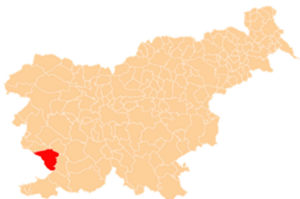
Slika 1: lega občine Sežana

Leta 1364 je Sežana pripadla goriškim grofom, z njihovim izumrtjem pa Habsburžanom. Občina je v začetku 18. stoletja s prihodom grofa Petača postala tudi upravno sodišče, rodbina pa se je v Sežani ohranila vse do 1817, v obdobju Napoleonovih osvajanj je tudi Sežana postala del Ilirskih provinc. Mesto Sežana je glede na ustno izročilo lahko dobila ime na dva načina: po sveti Suzani, kateri je bil posvečen eden od oltarjev v stari cerkvi, zgrajeni leta 1509; kot Susana je bilo mesto označeno tudi na zemljevidu Gerharda Mercatorja iz leta 1589 ali pa po Sežgani vasi oziroma po prvotnem naselju za hribom Tabor, ki naj bi bilo požgano.