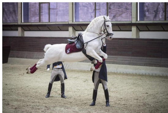
Slika 9: element Capriole