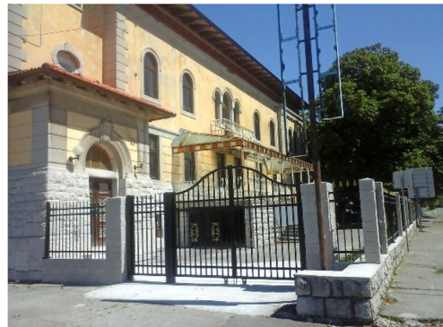
12. SLIKA: Adria danes