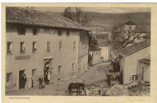
5. SLIKA: Pogled na senožeško cesto

Čeprav so se v preteklosti pojavila prizadevanja za ustanovitev lastne občine, Senožeče še danes ostajajo del občine Divača, ki je del primorske regije v Sloveniji. Kljub temu, da je politična ureditev kraja ostala nespremenjena, je Senožeče doživelo pomembne spremembe v gospodarstvu, infrastrukturi in družbenem življenju skozi stoletja. Ohranjanje edinstvene zgodovine in kulturne dediščine kraja je še danes pomemben del identitete Senožeč.