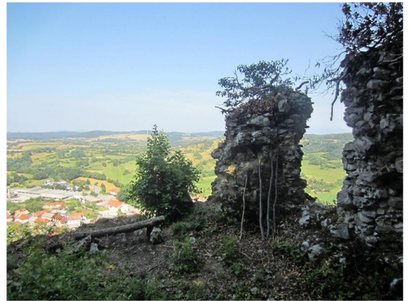
32., 33. SLIKA: stari grad