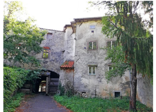
27., 28. SLIKA: Mitnica