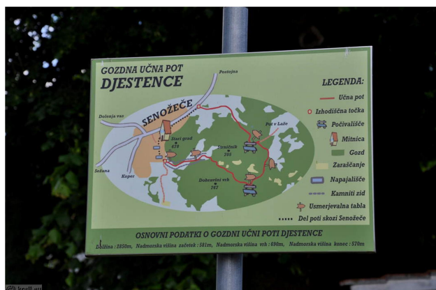
10. SLIKA: učna pot Djestence

Plesno društvo Srebrna že od leta 2006 razvija plesno kulturo na Senožeškem, vaščane v Kulturnem društvu Pepca Čehovin Tatjana združuje ne le kultura ampak tudi šport, turizem, zgodovina in običaji, Mešani pevski zbor razveseljuje s svojimi nastopi in uspehih na tekmovanjih, prostovoljno gasilsko društvo Senožeče je eno izmed dveh in hkrati osrednje gasilsko društvo v občini Divača. Skupaj s še šestimi društvi je vključeno v Kraško gasilsko zvezo.