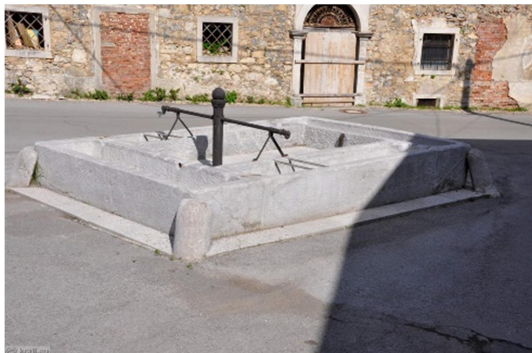
23. SLIKA: spodnja korita

Čez cesto korit so porušili nekdanje župnišče oziroma po domače Jančarjevo domačijo, več kot 200 let staro hišo sredi vasi. Od stavbe je ostalo le pročelje s slikovitim portalom.