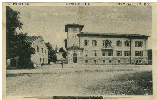
13. SLIKA: razglednica s sliko pivovarne Adrie

Značilna za Senožeče in Gabrče?, nekoliko manj za ostale senožeške vasi?, je ugotovitev, ki so jo razni pripovedovalci izrekli na vedno isti način: 'Vsa vas je služila furmanskemu in potniškemu prometu.' Za potniški promet velja ta ugotovitev v glavnem do izgradnje železnice, za furmanstvo pa tja do tridesetih let sedanjega stoletja. Skrb za furmane in potnike so Senožejci pokazali na različne načine.