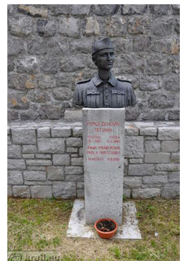
17., 18. SLIKA: spomeniki padlim borcem in žrtvam NOB