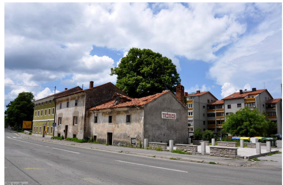
7. SLIKA: tržnica