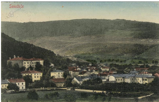
8. SLIKA: razglednica Senožeč

Vas je v sredini 16. stoletja dobila tržne pravice, v obdobju avstro – ogrske monarhije pa je bilo tukaj okrajno sodišče. Nekdaj so bile Senožeče poznane po velikih živinskih in lesnih sejmih.