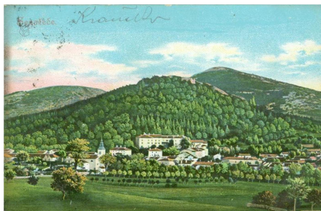
2. SLIKA: kolorirana razglednica Senožeč