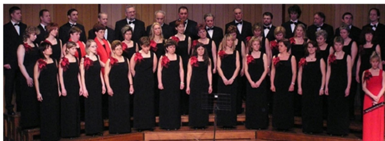
9. SLIKA: MePZ Senožeče