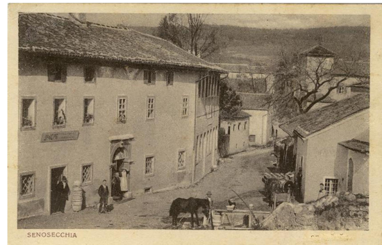
22. SLIKA: spodnji trg