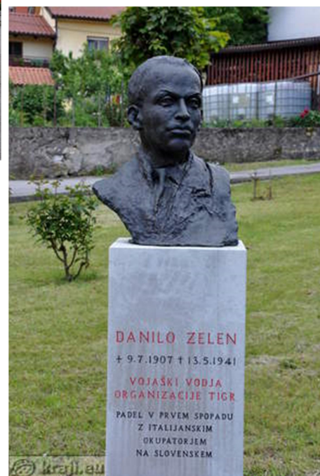
24. SLIKA: kip Danila Zelena