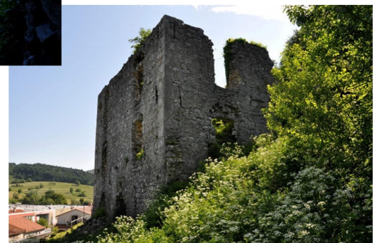
29., 30., 31. SLIKA: dvorec Snosetsch