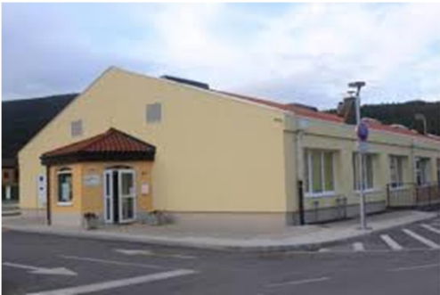
21. SLIKA: OŠ Senožeče

Cvetka v Senožečah je namreč potekala jubilejna prireditev, ki so jo z bogatim kulturnim programom oplemenitili učenci pod mentorstvom sedanjih učiteljic.