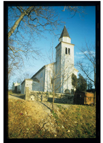
14., 15., 16. SLIKA: cerkev Sv. Jerneja