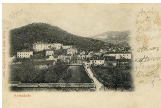
3. SLIKA: panorama Senožeč - razglednica

V starem delu naselja prevladujejo značilne kamnite sredozemske hiše. Skozi bogato zgodovino Senožeč pa še danes potekajo pomembne poti iz smeri morja v notranjost dežele.