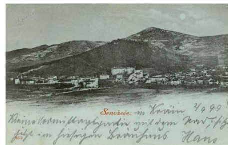
1. SLIKA: panorama Senožeč tiskana na zeleni podlagi