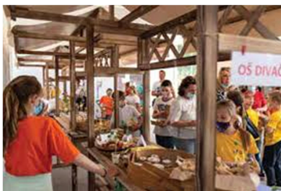
11. SLIKA: KUD Pepce Čehovin Tatjane