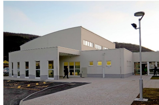
20. SLIKA: dvorana Rudolfa Cvetka