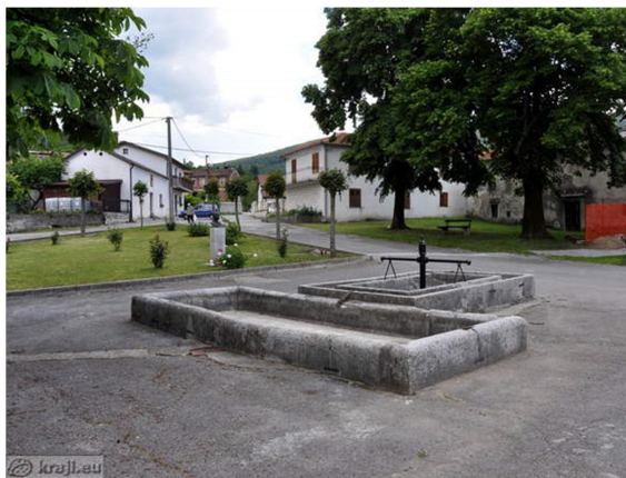
26. SLIKA: zgornja korita

Zelen je bil velik človek, zavzet antifašist in domoljub, ki se je boril za svoje ljudi, jezik, slovenski narod in kulturo. S svojimi vrlinami, kot so moč, pogum, vztrajnost, samozavest, izjemna sposobnost povezovanja ter nepopustljivo vztrajanje pri doseganju zastavljenih ciljev in idealov, se je za vselej zapisal v zgodovino slovenskega naroda kot velik borec za slovenstvo in priključitev Primorske k tedanji Jugoslaviji.