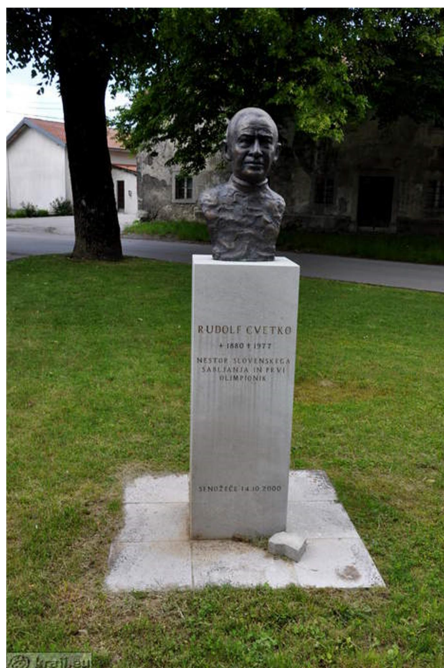
25. SLIKA: kip Rudolfa Cvetka