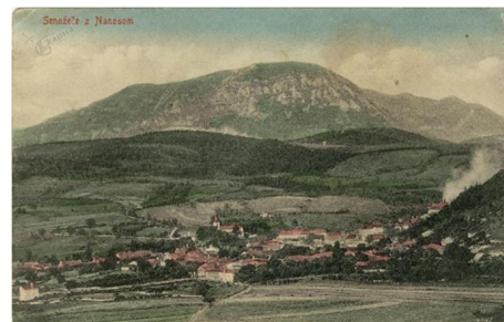
6. SLIKA: ročno kolorirana razglednica Senožeč