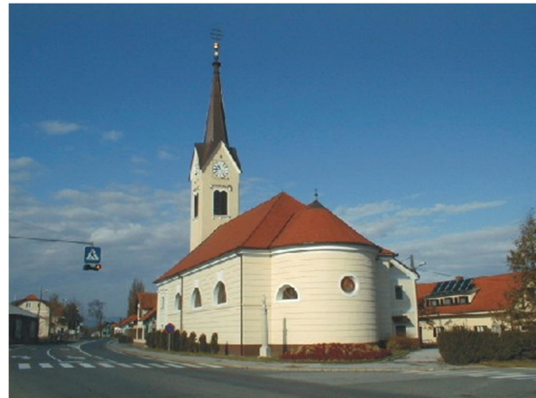
Cerkev Sv. Janeza Krstnika