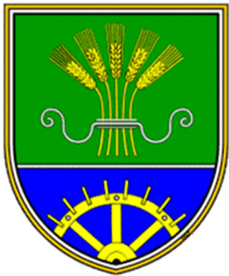
Grb Občine Starše