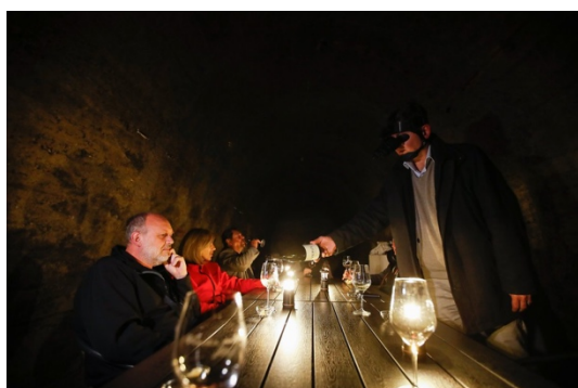
Slika 2: Degustacija vina v temi v rovu pod gradom