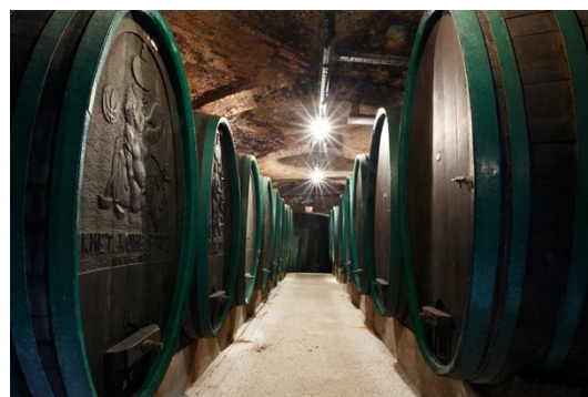
Slika 3: Ptujška vinska klet