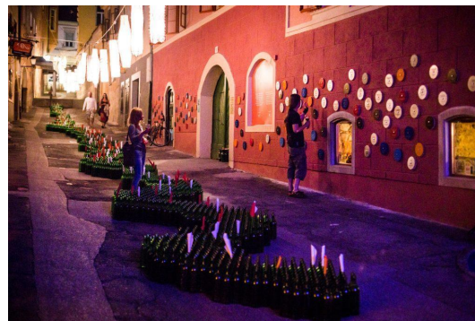
Slika 4: Razstava steklenic med festivalom Dnevi poezije in vina