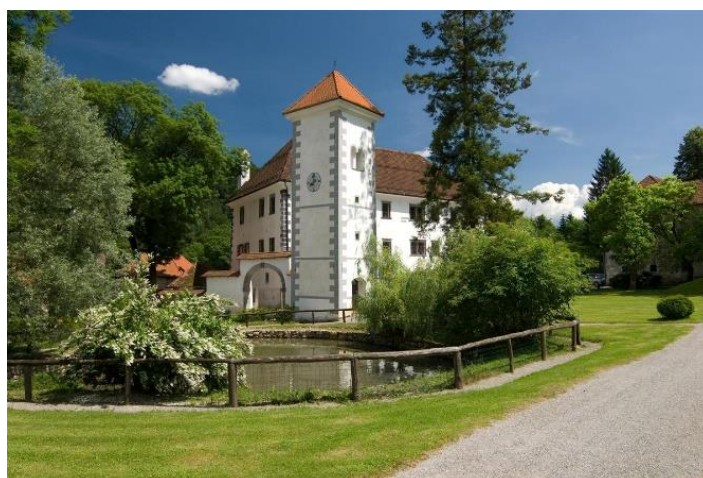
Slika 2: Polhograjska Graščina

Nadaljujemo s čajanko v Polhograjski graščini, kjer si boste lahko poleg čaja posladkali s kraljevskim kruhom, vrtničnim maslom, z vsemi okusi slovenskega medu in vrtničnim likerjem.