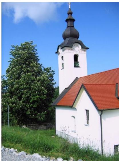
Slika 10: Cerkev sv. Ane

V tej vasi je znamenitost njihova cerkev sv. Ane, katera je postavljena v dolini malo odmaknjena od centra vasi. Zgrajena je bila v prvi polovici 16. stoletja. Legenda pravi, da so cerkev s prva hoteli postaviti na sedaj bližnjem griču cerkve, a vendar so ga vedno znova podrli in zavalili čez strmino in se te vedno ustavil tam kjer sedaj stoji cerkev sv. Ane na Butajnovi.