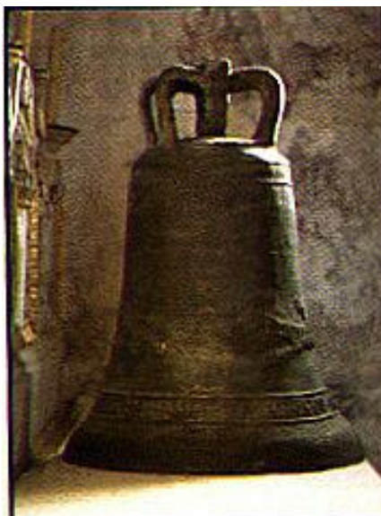
Slika 9: Najstarejši zvon na slovenskem

Iz Šentjošta se spustimo nazaj v dolino in vzpnemo na novo planoto, ki se imenuje vas pod imenom Butajnova.