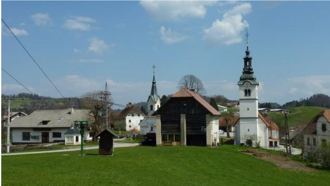
Slika 8: levo cerkev sv. Jošta, desno cerkev sc. Janeza Evangelista

Letnica baročne cerkve sv. Janeza Evangelista seže vse tja do leta 1664 sestavljajo pravokotna ladja, tri strano zaključen prezbitarij in zvonik prizidan k zahodni fasadi. Banjasto obokano ladjo in prezbitarij prekriva komplicirano mrežasto rebrovje. Glavni oltar stilistično sodi v konec 18. stoletja. (letnica na hrbtni strani 1735), stranska oltarja sta sočasna glavnemu.