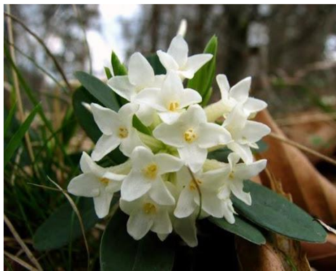
Slika 3: Blagajev Volčin

Na tem mestu pa še ponaša tudi znamenita roža Blagajev Volčin ali kraljeva roža (znanstveno ime Daphne blagayana ), katera je zaščitena. Odkril jo je 20. maja 1837, grof Rihard Blagaj na Polhograjski gori oziroma na Gori svetega Lovrenca (824m).