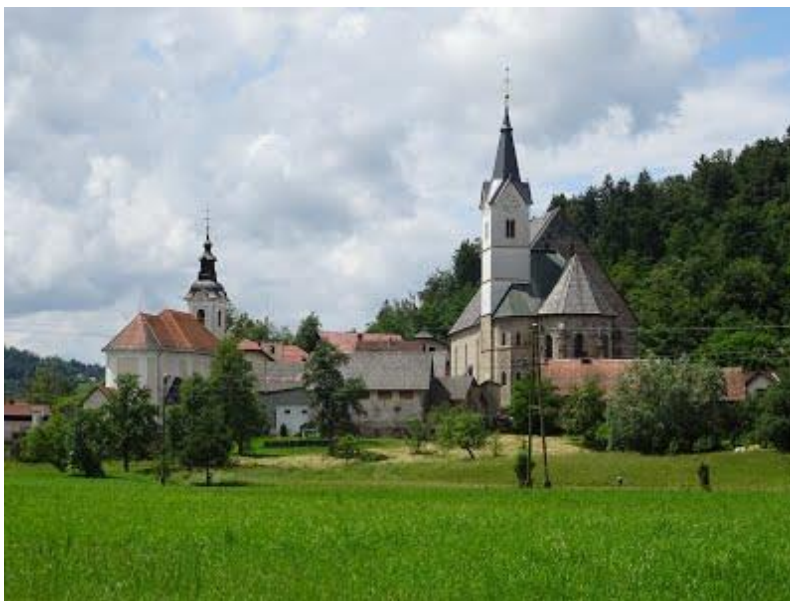
Slika 1: Cerkev sv. Petra

Celodnevni izlet začnemo z ogledom poznogotske cerkve sv. Petra v Dvoru. Bogata stavbna zgodovina poznogotske cerkve sv. Petra v Dvoru je tesno povezana z življenjem na Polhograjskem v 16. stoletju, o čemer pričajo številne letnice in grbi na arhitekturnih elementih. Njene glavne znamenitosti so bogato okrašen klesan portal, empore, dva kamnita baldahina in lesen poslikan strop v notranjosti, ki nosi slovenski napis iz 16. stoletja.