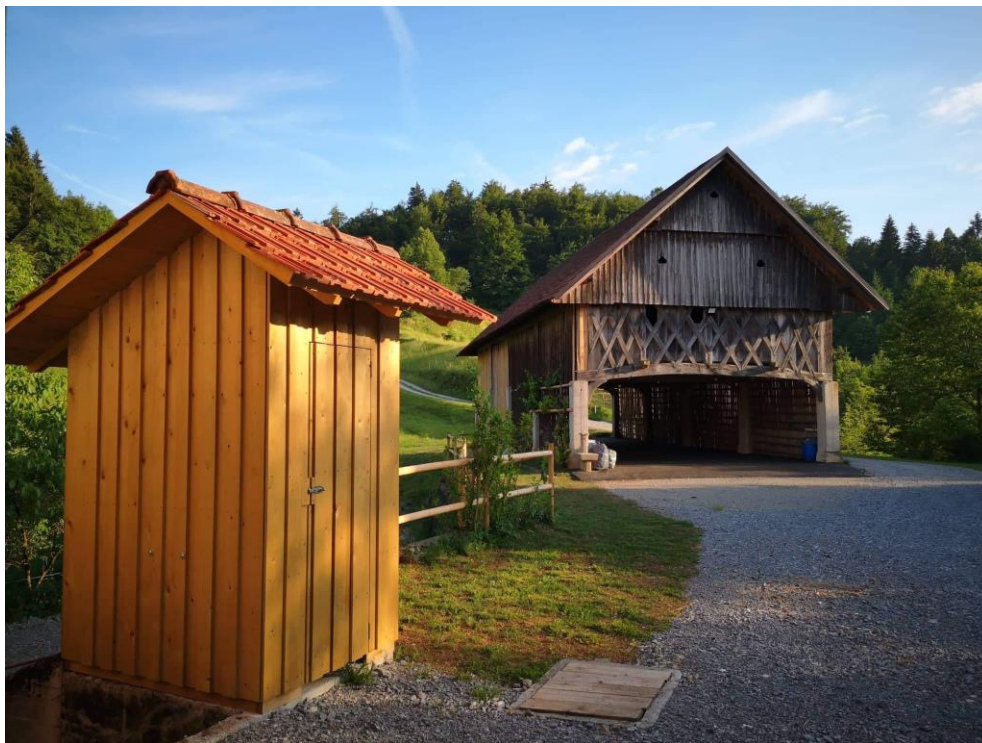
Slika 12: Piknik prostor pri Jereb (Toplar)

V Polhograjskih dolomitih bi lahko govorili in hodili cele dneve, a kaj ko čas ne dopušča,... Ima še kup znamenitih cerkva, športna igrišča, starih domačij, piknik prostorov, kjer se lahko sproščate v čudoviti naravi. Lep primerek je piknik prostor pri Jereb, ta se nahaja na Planini nad Horjulom ki ima lepo okolico obdano z gozdom. Je stara domačija, na kateri so lepo obnovili kozolec Toplar in pod njem naredili odličen prostor za piknike (zabave, obletnice, ...).