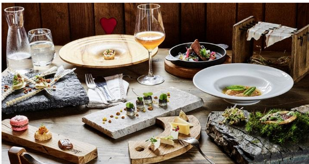
Slika 7: Kulinarčni izdelki

Večina sestavin za jedi je pridelanih na ekološki kmetiji Koširjevih, ki slovi tudi po svoji račji farmi, ter pri drugih okoliških kmetih. Dimljene račje prsi so ena od specialitet na Koširjevem jedilniku, ki je vedno prilagojen sezoni. Na njem se domače mesnine in siri kombinirajo z domiselnimi jedmi, ki jih zaznamujeta minimalizem in poln okus.