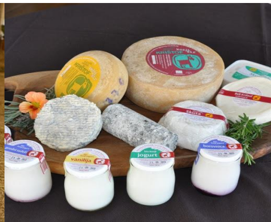
Slika 5: Mlečni izdelki njihove ekološke kmetije

Tu bomo imeli degustacijo njihovih domačih izdelkov, naprej pa se podamo v znamenito gostišče Grič.