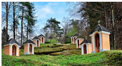
Slika 5: Kalvarija

Leta 2001 je bila Kalvarija obnovljena in osvetljena, kar je še dodatno poudarilo njeno arhitekturno lepoto. Kapelice križevega pota prikazujejo prizore iz Kristusovega trpljenja in smrti ter so izdelane v baročnem slogu. Kalvarija je pomemben kulturni spomenik in turistična atrakcija ter predstavlja tipičen primer krajinske arhitekture. Sprehod po poti čez kalvarije je zelo lep tudi ponoči saj so vse kapelice posamično osvetljene.