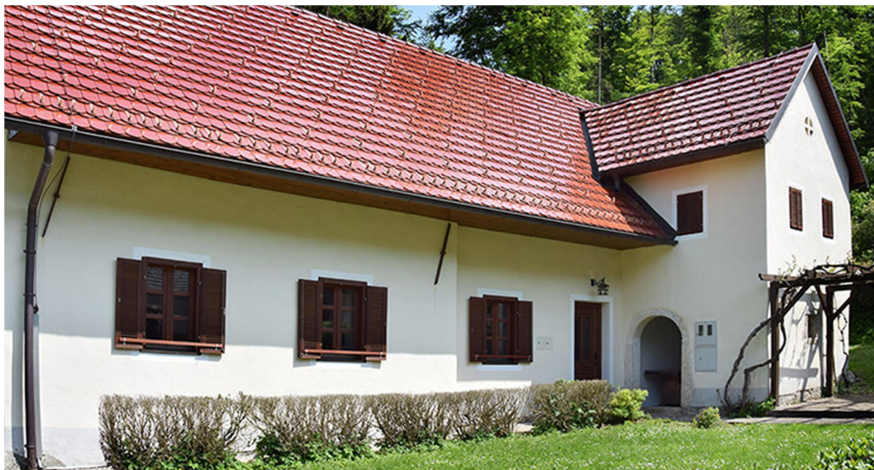
Slika 7: Rojstna hiša Jakoba Aljaža

Franc Rozman (Stane Mlinar) velja za partizanskega narodnega heroja Franc Rozman - Stane se je rodil 27. marca 1911 v Spodnjih Pirničah pri Medvodah. Imel je težko in revno otroštvo, določili so mu skrbnike in eden izmed njih je bil Valentin Tine Rožanc, komunist in kasnejši narodni heroj. Prav on je vplival na Franca, da je postal somišljenik komunizma.