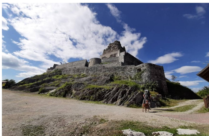
Slika 4: Grad Smlednik