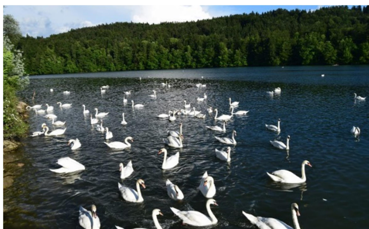
Slika 3: Zbiljsko jezero

Pozimi, če so temperature dovolj pod lediščem, jezero zamrzne, pri tem pa je prav zanimivo opazovati labode, ki "drsajo" po jezeru. Obisk jezera je primeren v vseh letnih časih, zaradi svoje narave se vedno pokaže v drugačnih barvah. Je pravi kraj za ljubitelje fotografiranja.