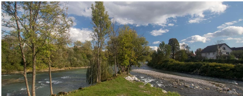
Slika 1: Stičišče Sore in Save

Blizu stoji Medvoška knjižnica in stavba Občinske uprave, prav sotočje pa nudi možnost za krajši oddih ali postanek ob romantičnem večernem sprehodu. Med domačini pa velja rek, da nisi pravi Medvoščan, če nisi vsaj enkrat zaplaval v sotočje.