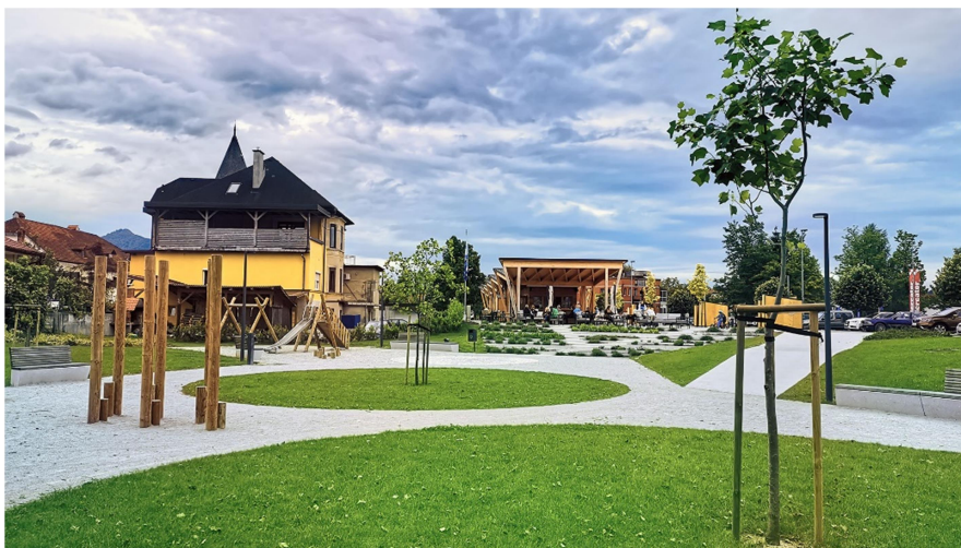
Slika 2: Park Branislave Sušnik

Po tem se bomo odpravili mimo tržnice Medvode, proti parku Branislave Sušnik. Branislava je bila raziskovalka, antropologinja, humanistka in borka za pravice staroselskih plemen v Paragvaju. Življenje je posvetila jezikom indijanskih plemen, njihovim navadam in se zavzemala za njihove pravice. Po kratkem sprehodu pa se bomo odpravili do avtobusne postaje kjer nas bo že čakal osebni prevoz.