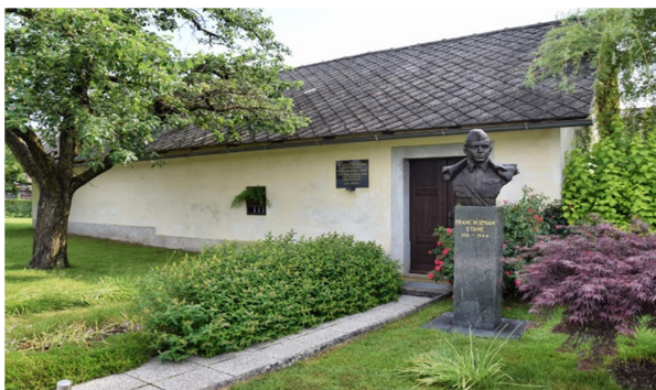
Slika 8: Rojstna hiša Franca Rozmana Staneta

Sedmega novembra se je hudo poškodoval med preizkušanjem novega orožja – minometa, ki so ga partizanom poslali britanski zavezniki, in še istega dne umrl v bolnišnici OF Kanižarica pri Črnomlju. Začasno je bil pokopan v Črnomlju, leta 1949 pa je bil prekopan v Grobnico narodnih herojev v Ljubljani.