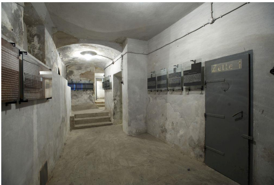
Slika 4: Gestapovski zapori v Dravogradu

V kletnih prostorih so med 2. svetovno vojno imeli sedež gestapovci. Pet kletnih prostorov so preuredili v zaporniške celice, kamor so zapirali ljudi. Celice so ohranjene skupaj z zaporniškimi vrati, razstavljenih je tudi nekaj predmetov vezanih na ljudi, ki so bili zaprti tukaj. Na stenah celic so tudi fotokopije preslikav napisov, ki so jih zaporniki napisali na steno celice. Po ogledu nadaljujemo pot na glavni trg.