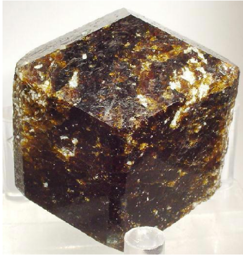
Slika 6: Mineral Dravit