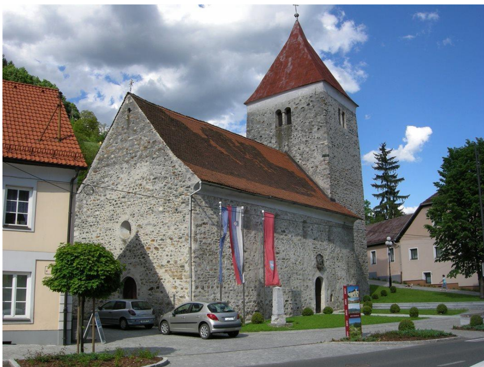
Slika 5: Cerkev sv. Vida

Po ogledu TIC-a se obiskovalcem zahvalimo za obisk in se priporočimo za naslednji obisk.