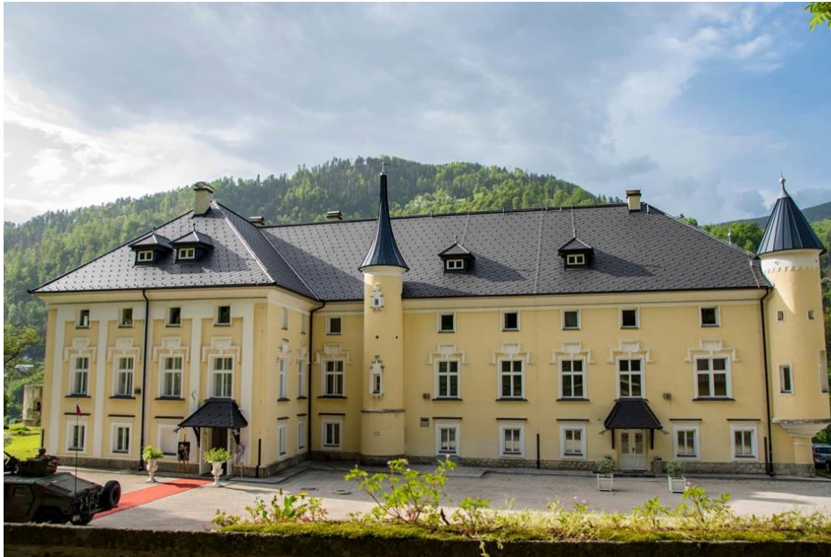
Slika 2: Dvorec Bukovje

Vrnemo se pred dvorec Bukovje, kjer predlagamo skupinsko fotografijo.