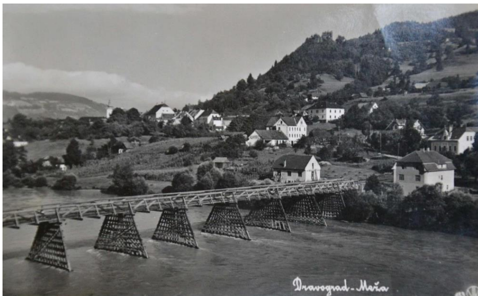
Slika 3: Leseni most čez Dravo leta 1939

Obiskovalcem postavimo vprašanje, če so si zapomnili, kdaj je bil most prvič omenjen . V primeru pravilnega odgovora jih pohvalimo, v primeru napačnega pa opomnimo, naj bolje poslušajo. Pot nadaljujemo čez most proti občinski stavbi, kjer se nahajajo gestapovski zapori.