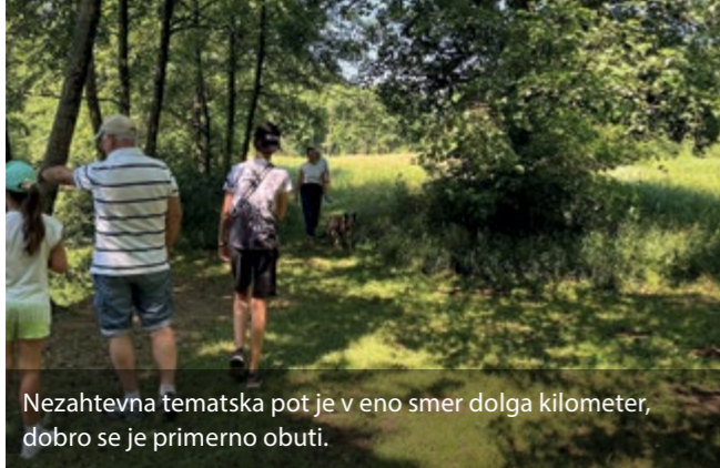
Nezahtevna tematska pot je v eno smer dolga kilometer, dobro se je primerno obuti.

Rekreacija, radoživost, zabava in raziskovanje na prostem obiskovalcem nudi tematska Pot modrega bleščavca ob reki Rašici v Velikolaški deželi. V slednji že desetletja slovi domačija očeta slovenskega knjižnega jezika Primoža Trubarja, prav pri vhodu pa je v interpretacijskem centru izhodiščna točka za Pot modrega bleščavca, bolj znanega kot kačjega pastirja.