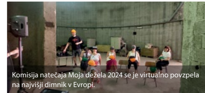
Komisija natečaja Moja dežela 2024 se je virtualno povzpela na najvišji dimnik v Evropi.