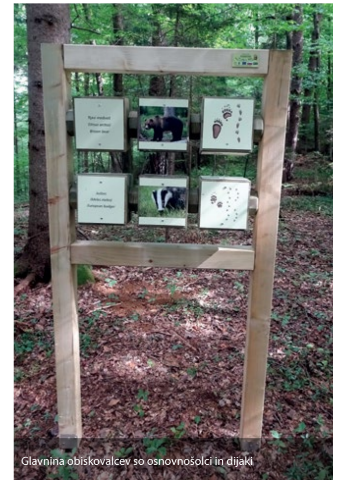
Glavnina obiskovalcev so osnovnošolci in dijaki

Besedilo: Egon Vočko, vodnik in gozdar