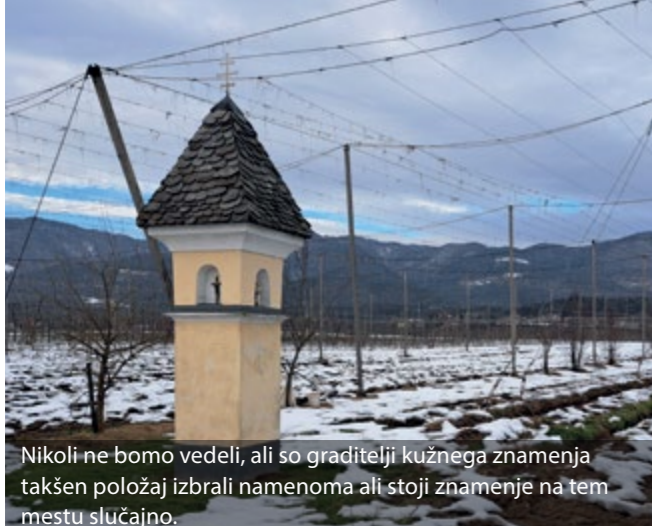
Nikoli ne bomo vedeli, ali so graditelji kužnega znamenja takšen položaj izbrali namenoma ali stoji znamenje na tem mestu slučajno.