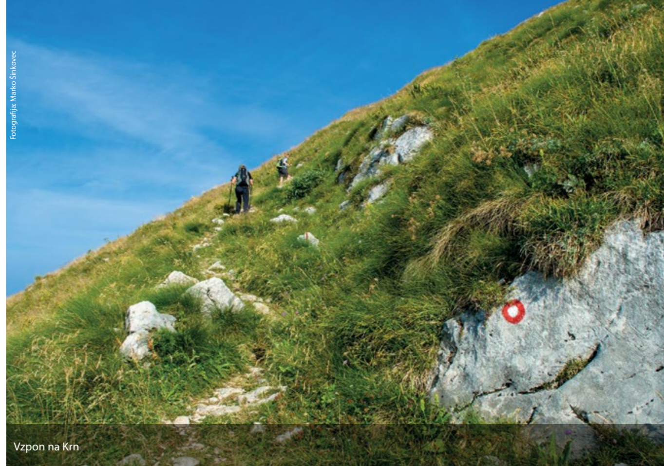
Vzpon na Krn