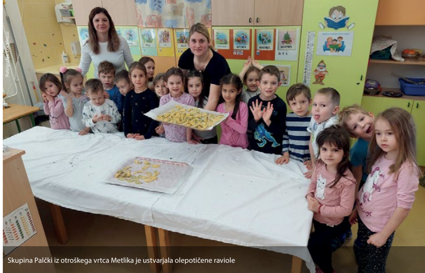
Skupina Palčki iz otroškega vrtca Metlika je ustvarjala oleptične raviole