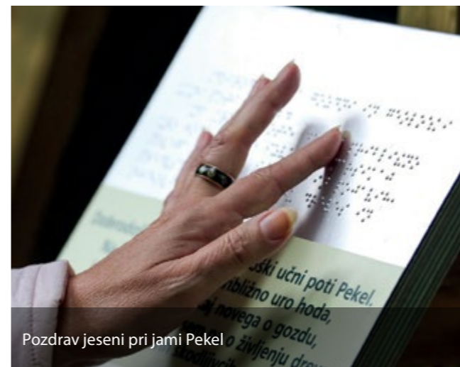
Pozdrav jeseni pri jami Pekel

Ob začetku vodenega ogleda gozdne in geološke učne poti Pekel obiskovalcem najprej predstavim osnovne podatke o učni poti in način, kako bodo vsebine predstavljene. Povprašam jih o njihovih pričakovanjih ter vsebinah, ki jih mogoče še posebno zanimajo. Večina obiskovalcev si predstavlja vodenje po učni poti kot predavanje o naravi s krajšim sprehodom. Ko jih ob koncu vodenja povprašam o tem, kako so bili z vodenjem zadovoljni, ali so bila izpolnjena njihova pričakovanja, so odzivi dobri. Večina obiskovalcev se kmalu po začetku vodenja sprosti. Vodenja ne jemljejo več kot suhoparno predavanje. Gozd doživljajo na drugačen, mogoče bolj poglobljen in celosten način. Z nazornim in doživljajskim podajanjem vsebin jim vzbudim zanimanje. Delovanje gozda, zakonitosti v naravi, vloge, ki jih gozdovi opravljajo postanejo skozi