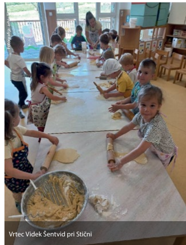
Vrtec Videk Šentvid pri Stični

tradicionalni slovenski gostilni Repolusk, v kateri so med drugim izumili tudi črni kruh iz oglja, s katerim so 14. junija okronali 24. Vseslovensko srečanje oglarjev, so si ogledali kuhinjo in kuhinjske pripomočke in sodelovali pri pripravi pogrinjka in sladice.