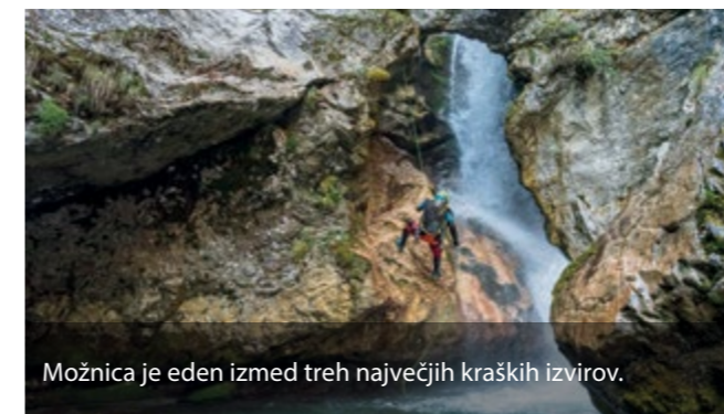
Možnica je eden izmed treh največjih kraških izvirov.

Naslednja na seznamu presežkov je Možnica. Tudi ta je burila našo domišljijo, saj smo bili še do nedavnega prepričani, da jo je zaradi visokih vodostajev poleti nemogoče varno obiskati. A suša, ki je zadnjih nekaj poletij precej pogosta, je naše prepričanje obrnila na glavo. To muhasto gospo najdemo v dolini Možnice, med Logom pod Mangartom in Bovcem. Žal je v drugem varstvenem območju Triglavskega narodnega parka, zato je soteskanje v Možnici