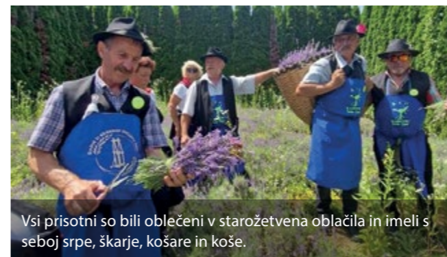
Vsi prisotni so bili oblečeni v starozetvena oblačila in imeli s seboj srpe, škarje, košare in koše.