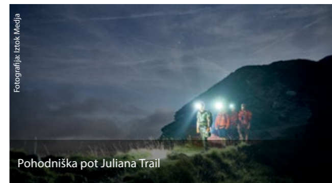
Pohodniška pot Juliana Trail

Treba je razvijati specifične produkte iz najboljšega, kar ima določena destinacija, za kar ima tradicijo. Ciljna skupina, ki v Slovenijo pride zaradi specifičnega produkta, je veliko bolj vodljiva in dozvetna za usmerjanje kot splošna turistična populacija. Značilni primer takšnih turistov, ki jih je po kovidu manj, so obiskovalci z azijskih trgov, ki v 14 dneh obdelajo vso Evropo.