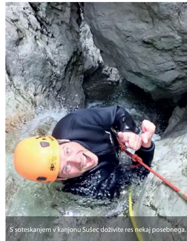
S soteskanjem v kanjonu Sušec doživite res nekaj posebnega.

Pridružite se Soča Rafting, d. o. o., in doživite nepozabne avanture v dolini Soče!