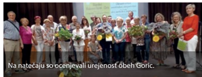
Na natečaju so ocenjevali urejenost obeh Goric.