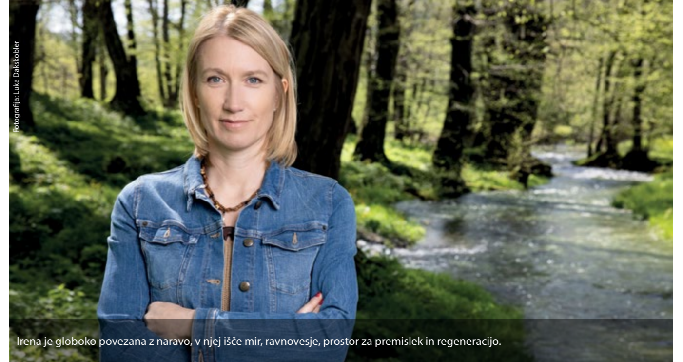
Irena je globoko povezana z naravo, v njej išče mir, ravnovesje, prostor za premislek in regeneracijo.