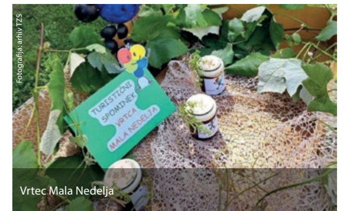
Vrtec Mala Nedelja