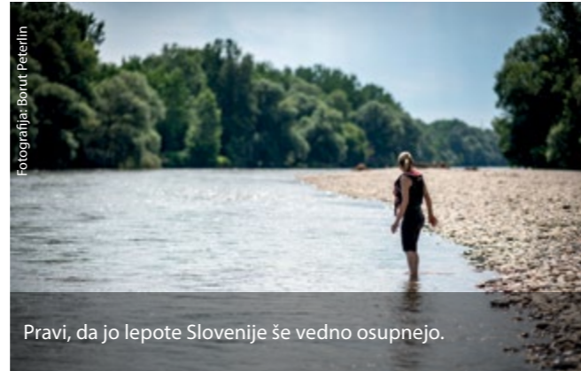
Pravi, da jo lepote Slovenije še vedno osupnejo.

Bosljivi Loki, to je lepo urejeno rečno kopališče pred Osilnico, kjer lahko skačeš v Kolpo ali zgolj brodiš po strugi, temperatura vode tudi poleti ne doseže več kot 20 stopinj Celzija.