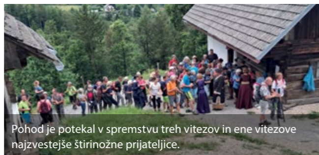
Pohod je potekal v spremstvu treh vitezov in ene vitezove najzvestejše štirinožne prijateljice.

Besedilo in fotografije: TD Žlebe- Marjeta