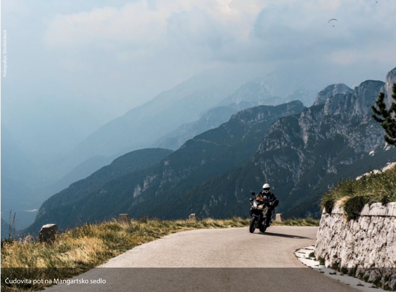
Čudovita pot na Mangartsko sedlo