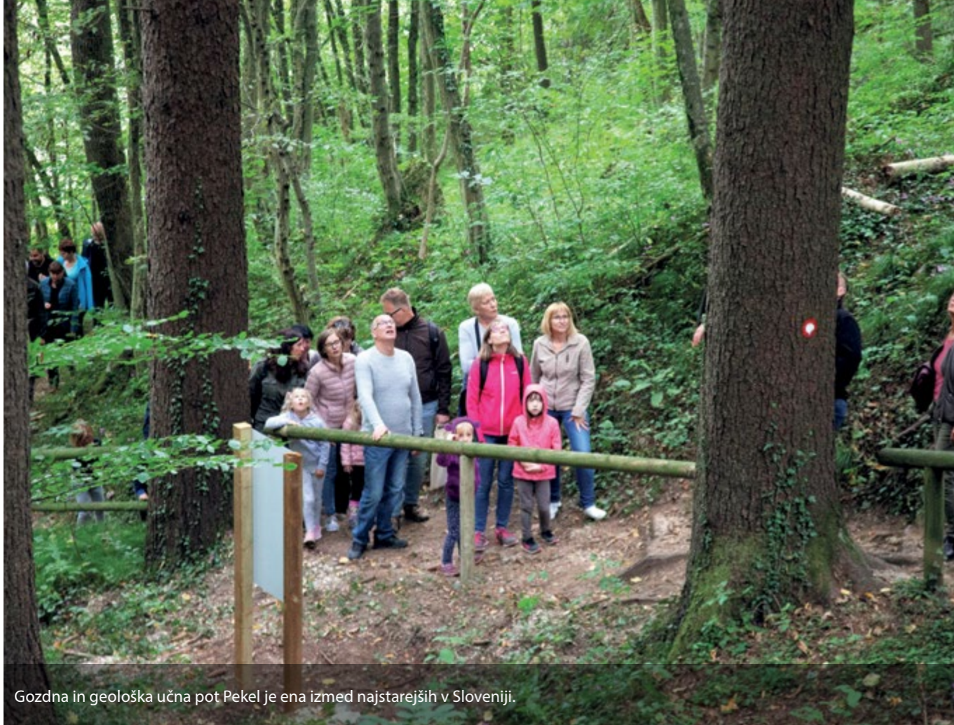
Gozdna in geološka učna pot Pekel je ena izmed najstarejših v Sloveniji.