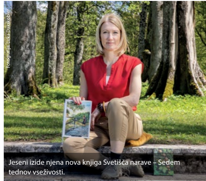
Jeseni izide njena nova knjiga Svetišča narave – Sedem tednov vseživosti.

Vedno znova me kaj osupne. Za zadnjo knjigo so me biologinje peljale na Murišo, eno najbolj ohranjenih mrtvic Mure, v Mursko šumo, prvič sem videla naravno strugo te veličastne reke. Pri Otoku ljubezni in lžakovcih, ki je recimo eden od mojih izletniških ciljev v Pravljicnih poteh Slovenije, je Mura še vedno regulirana. Šele pozneje teče bolj svobodno in njena vodna ustvarjalnost pride res do izraza. Skupaj z Dravo in Donavo velja za evropsko Amazonko, saj vse tri reke skupaj tvorijo najdaljše, okrog sedemsto kilometrov dolgo, največje zaščiteno rečno območje v Evropi. Na Muri so me ujele tudi lanske katastrofalne poplave. Ko vidiš količino, moč, tudi veličino njenih voda, te res osupne.