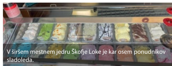
V širšem mestnem jedru Škofje Loke je kar osem ponudnikov sladoleda.

Besedilo: Igor Drakulič, TD Škofja Loka