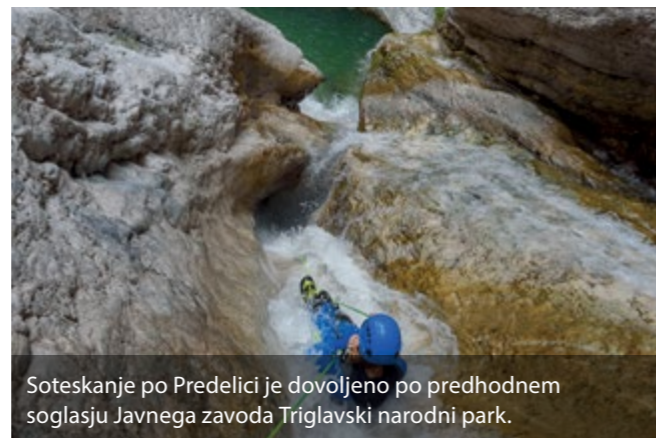
Soteskanje po Predelici je dovoljeno po predhodnem soglasju Javnega zavoda Triglavski narodni park.

Pravzaprav edina na seznamu najlepših slovenskih sotesk, kjer je pogojno dovoljeno soteskanje, je Predelica. Za dovoljenje moramo pridobiti soglasje Javnega zavoda Triglavski narodni park in plačati pristojbino za uporabo infrastrukture prek prijavnice aplikacije. Žal tudi pri soteskanju ne gre brez birokracije. Vstopimo pod predelsko trdnjavo in za bližnjico do Loga pod Mangartom uporabimo Predelico. No, trajalo bo res nekoliko dlje, a izkušnja bo ustvarila močne nevrnske vezi v vaših možganih in še dolgo ne bo zapustila vašega spomina ... Zgornji del soteske je precej neokrnjen, pričnemo s skoki v smaragdne bazene, nato se še nekajkrat spustimo po vrvi, in že smo v spodnjem delu soteske, kjer se nam pridruži Mangartski potok. Znajdemo se na mestu, kamor je leta 2000 prihrumel plaz in opustošil vso sotesko ter pozneje poskrbel za urbanistično preurejanje vasi Log pod Mangartom. A narava zna poskrbeti zase in vzpostaviti normalno stanje, zato je nadaljevanje soteskanja mogoče. V spodnjem delu najdemo še nekaj zanimivih skokov in spustov po vrvi ter soteskarsko turo zaključimo pod osupljivim Poševnim slapom. Soteskanje v Predelici je ob normalnih vodostajih primerno tudi za