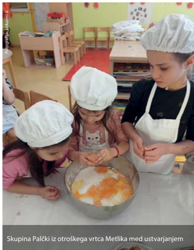
Skupina Palčki iz otroškega vrtca Metlika med ustvarjanjem