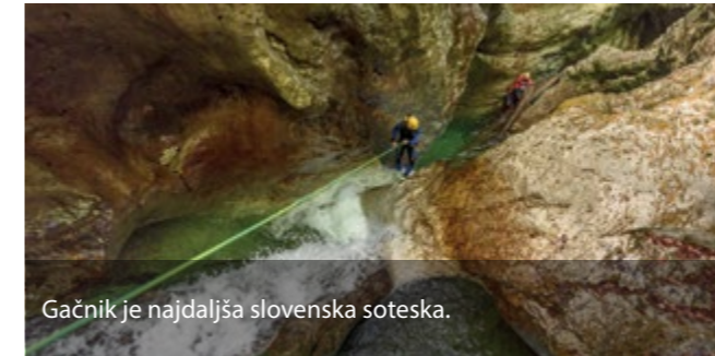
Gačnik je najdaljša slovenska soteska.

»Tam nekje na obronkih Idrijskega hribovja je. Zlovešča soteska, za katero potrebuješ dva dneva, da prideš skozi. Ni ravno za vsakega. Mi smo šli, a nam je zmanjkalo dnevne svetlobe, potem se nas je pet spravilo skozi kanjon z eno čelko.« To so besede, ki sem jih kot soteskarski zelenec slišal od izkušenejših soteskarjev. No, pozneje se je izkazalo, da so imeli le za ščepec več izkušenj in precej sreče ... A vendar, Gačnik je še dolgo ostajal na mojem seznamu kot večdnevna avantura, za katero se nikoli nisem počutil ustrezno pripravljen.