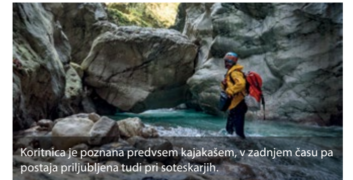
Koritnica je poznana predvsem kajakašem, v zadnjem času pa postaja priljubljena tudi pri soteskarjih.

Pod trdnjavo Kluže je še en del Koritnice, ki je ob nižjih vodostajih tudi primeren za soteskanje – vendar le za izkušene soteskarje. Po strmem spustu, ki se prične le streljaj od trdnjave, nas pričaka prava pravcata reka, ki je izdolbena 70m globoka korita. Ponovno se srečamo z mikavno vodo, ki nas ponese skozi korita, vendar moramo biti pri tem še kako pazljivi na sifone. A z ustrezno mero pozornosti je soteskanje v Koritnici nepozabna izkušnja.