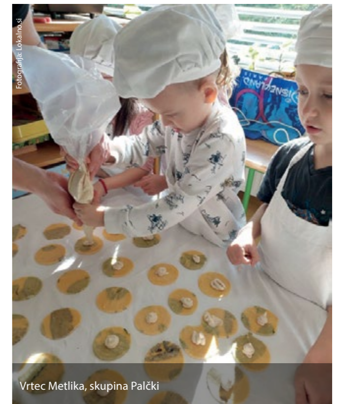
Vrtec Metlika, skupina Palčki

Vrtčevski otroci iz vse Slovenije so v okviru projekta spoznavali različne okuse, obirali so grozdje, si ogledovali vinske kleti in degustirali sok, igrali so vloge kuhar-natakar, kupec-prodajalec na vrtčevski tržnici, pridelovali so skuto in pripravljali štruklje, kuhali so zelenjavne juhe in pripravljali sokove, suho sadje, zdrave prigrizke v obliki sadnih nabolov, sire, grajske pojedine z grajskim pogrinjkom, spoznavali in nabirali so užitne divje rastline in zelišča in še marsikaj. V ospredju je bilo spoznavanje tradicionalne kulinarike in receptov ter lokalno pridelane, kar seveda pomeni tudi zdrave hrane. Med drugim so se naučili, da se hrane ne meče stran, iz sadja, ki jim je ostalo od malice, so tako skuhalih mešano marmelado.