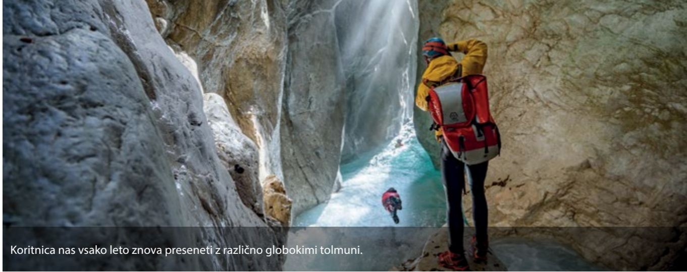
Koritnica nas vsako leto znova preseneti z različno globokimi tolmoni.