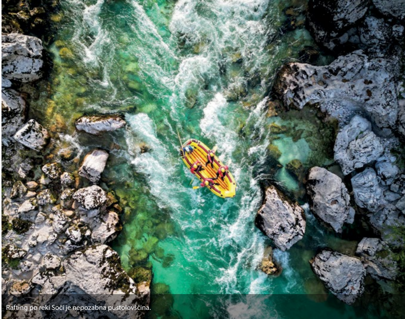
Rafting po reki Soči je nepozabna pustolovščina.