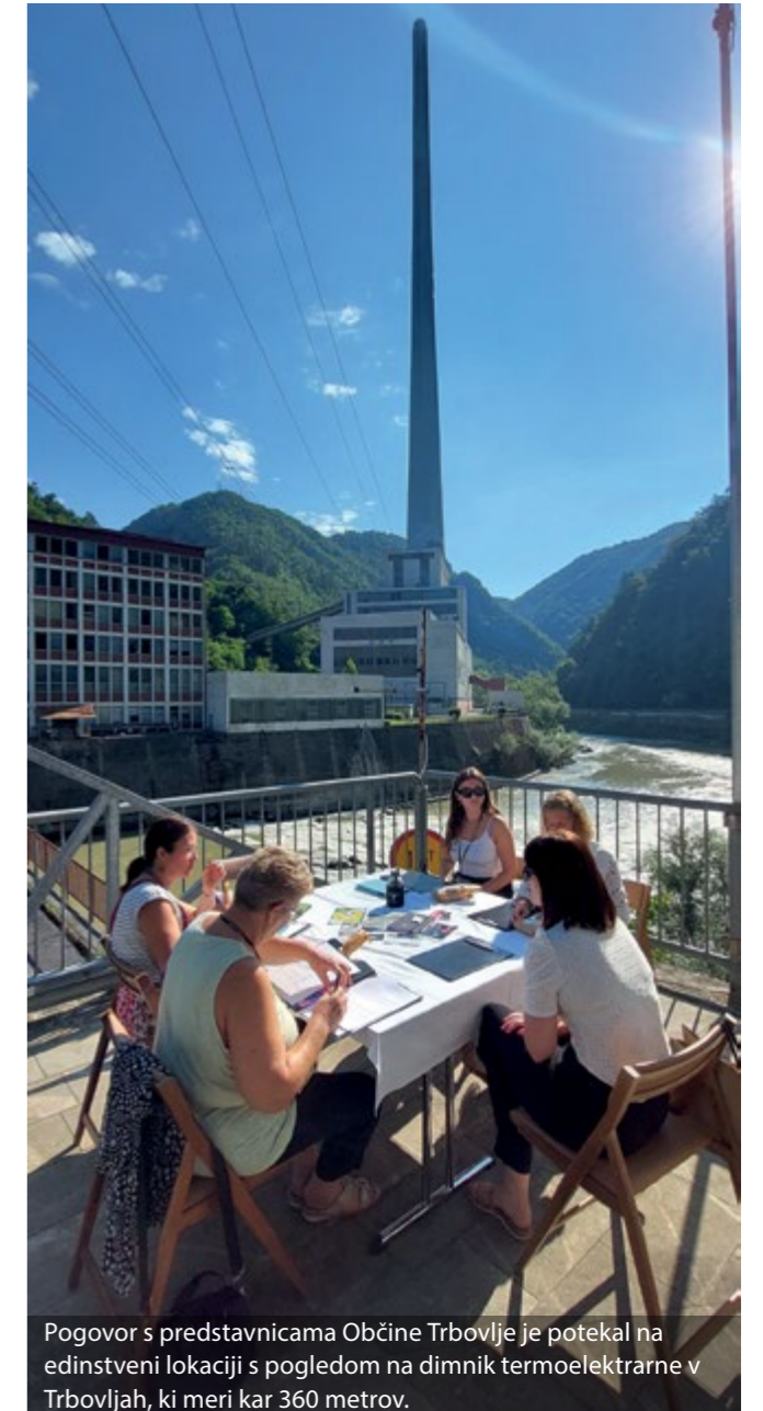
Pogovor s predstavnicama Občine Trbovlje je potekal na edinstveni lokaciji s pogledom na dimnik termoelektrarne v Trbovljah, ki meri kar 360 metrov.