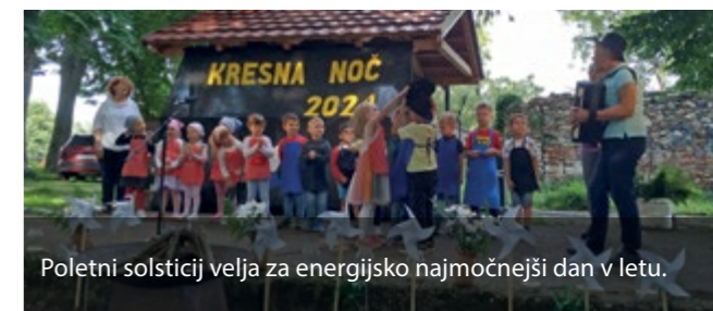
Poletni solsticij velja za energijsko najmočnejši dan v letu.

Besedilo in fotografija: Franci Padežnik, TD Viničar Zgornja Polskava