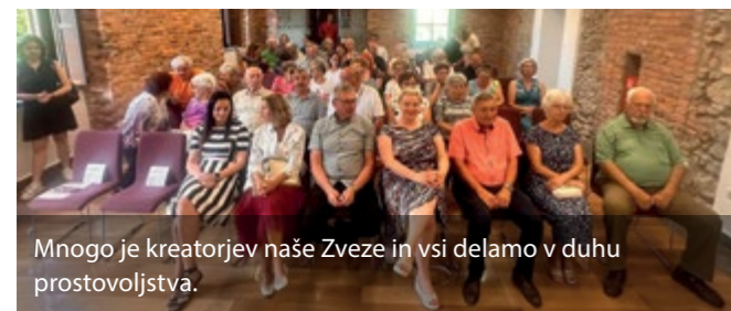
Mnogo je kreatorjev naše Zveze in vsi delamo v duhu prostovoljstva.

Na področju turizma so bila takrat glavna (edina) gonilna sila prav turistična društva (nekatera so uradna, druga tudi ne), a ker ni bilo nikogar za koordinacijo društev, niti sistemskega financiranja, se je pojavila želja, da je treba čim prej ustanoviti občinsko turistično zvezo kot povezovalno organizacijo vseh krajevnih dejavnikov turistične ponudbe, da bi popestrili življenje turistov in domačinov v občini. Med drugim je bilo izpostavljeno, da je treba vključevati mladino v članstvo turistične društvene organizacije, širiti turistični podmladek in krečiti privrženost članov turistični društveni organizaciji.