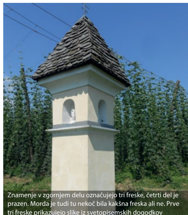
Znamenje v zgornjem delu označujejo tri freske, četrti del je prazen. Morda je tudi tu nekoč bila kakšna freska ali ne. Prve tri freske prikazujejo slike iz svetopisemskih dogodkov