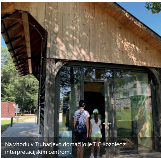
Na vhodu v Trubarjevo domačijo je TIC Kozolec z interpretacijskim centrom.

V nekdanjem kozolcu so uredili turistično-informativni center TIC Kozolec za Velikolaško deželo in interpretacijski center za Miško dolino. V njem obiskovalci lahko raziščejo vodotoke, ki so oblikovali Miško dolino, spoznajo, kaj trenutno cveti v tej dolini, si v lesenem herbariju ogledajo zavarovane rastline, spoznajo vidro Arturja, polha, navade netopirjev, ptic in ostalih živali v dolini. Z zaslona za predvajanje filmčkov – posnetkov raziskujejo sledove, zvoke in žive slike iz življenja v dolini. Najmlajši obiskovalci v temi raziskujejo po lovski preži, ustvarjajo z miško in kačjim pastirjem. Vstop v interpretacijski center je prost, v njem obiskovalci izvedo veliko zanimivosti, med drugim o kačjem pastirju, ki je zaščitni znak Miške doline. Večina se šele nato poda na omenjeno pot, ki vodi en kilometer ob reki Rašici navzgor mimo mokrotnih travnikov. »Tematska pot je lahka, primerna za vse starosti, dobro je nositi primerno obutev. Obisk poti traja eno uro, lahko tudi več, odvisno, kako zelo ste radovedni,« razložijo v TIC. Obiskovalci, ki se podajo na pot, sledijo ribiški stezi in smerokazom z zeleno puščico, ob stezi so tablice s pojasnili o cvetočih rastlinah, po nekaj sto metrih hoje že naletijo na prvo postajo s stebričkom in klopco. Sicer ima pot štiri postaje, na katerih so stebrički z interpretacijo: »Vse se vrti, vse je povezano. Ko človek prisluhne naravi. Mokrotni travnik je moj dom. Kje se skriva nizko barje.«