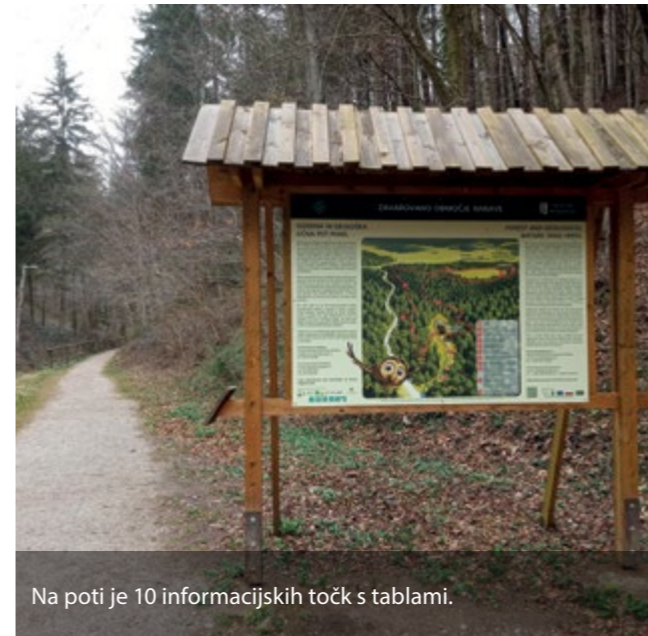
Na poti je 10 informacijskih točk s tablamami.

V zadnjem obdobju je veliko govora o podnebnih spremembah, ki v obliki naravnih ujm vplivajo na podobo naših gozdov. Vse več je