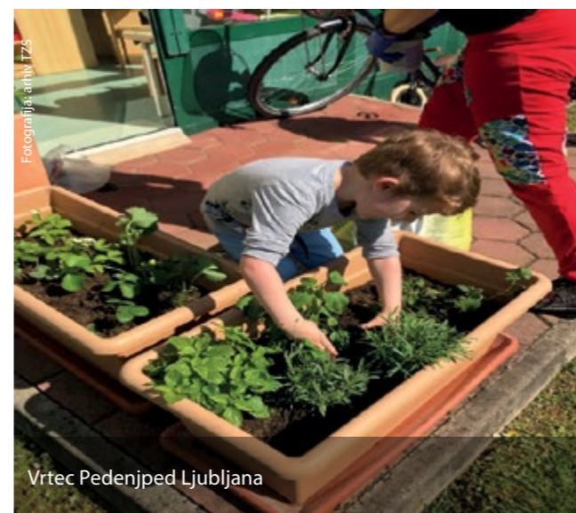
Vrtec Pedenjped Ljubljana