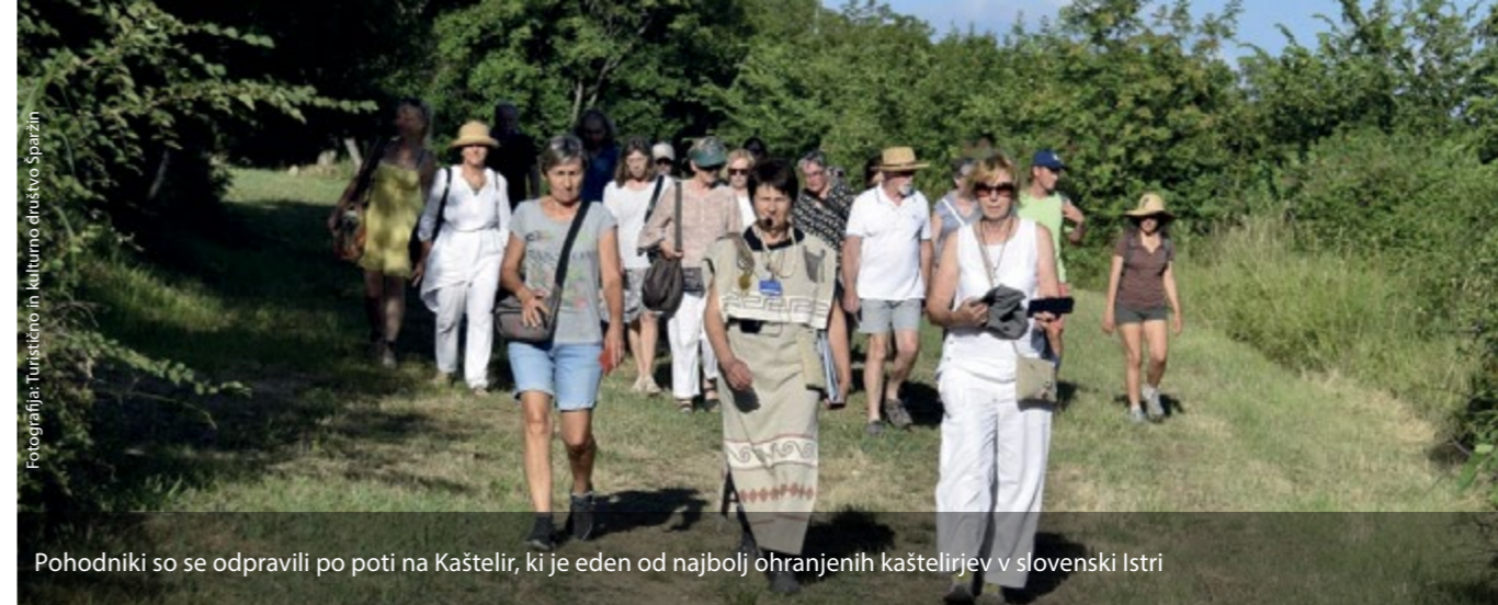
Pohodniki so se odpravili po poti na Kaštelir, ki je eden od najbolj ohranjenih kaštelirjev v slovenski Istri