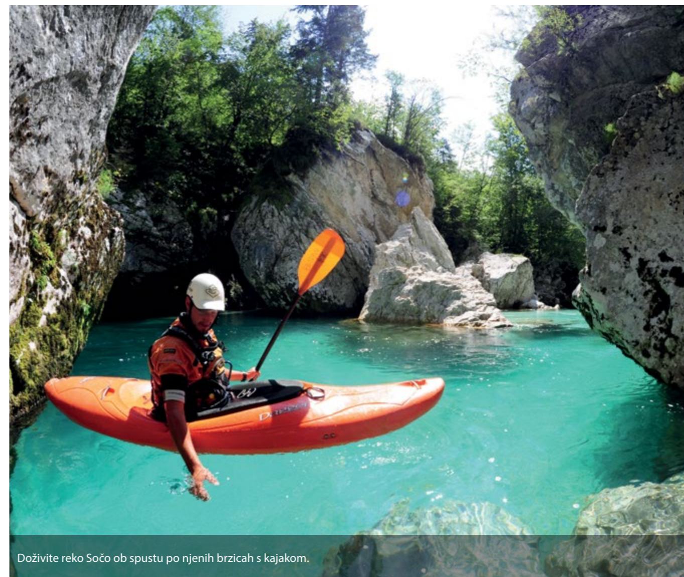
Doživite reko Sočo ob spustu po njenih brzicah s kajakom.