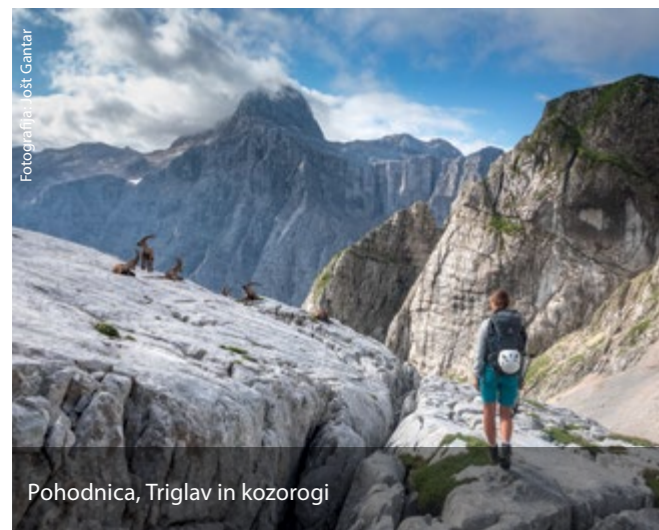
Pohodnica, Triglav in kozorogi

Ko se bomo začeli zavedati pomembnosti takšne infrastrukture, jo z