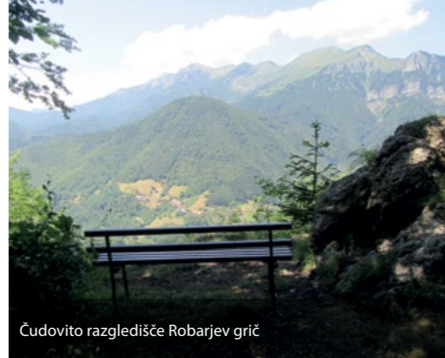
Čudovito razgledišče Robarjev grič

Kulturno-tehnično-turistično društvo Baška dediščina vas vabi na pot enajstih življenjskih zgodb umeščenih v osem vasi v prelepi Baški grapi. Pot so poimenovali Barac odsevom dediščine *, ki je nadaljevanje projekta Ljudje, ki so pustili sledi.