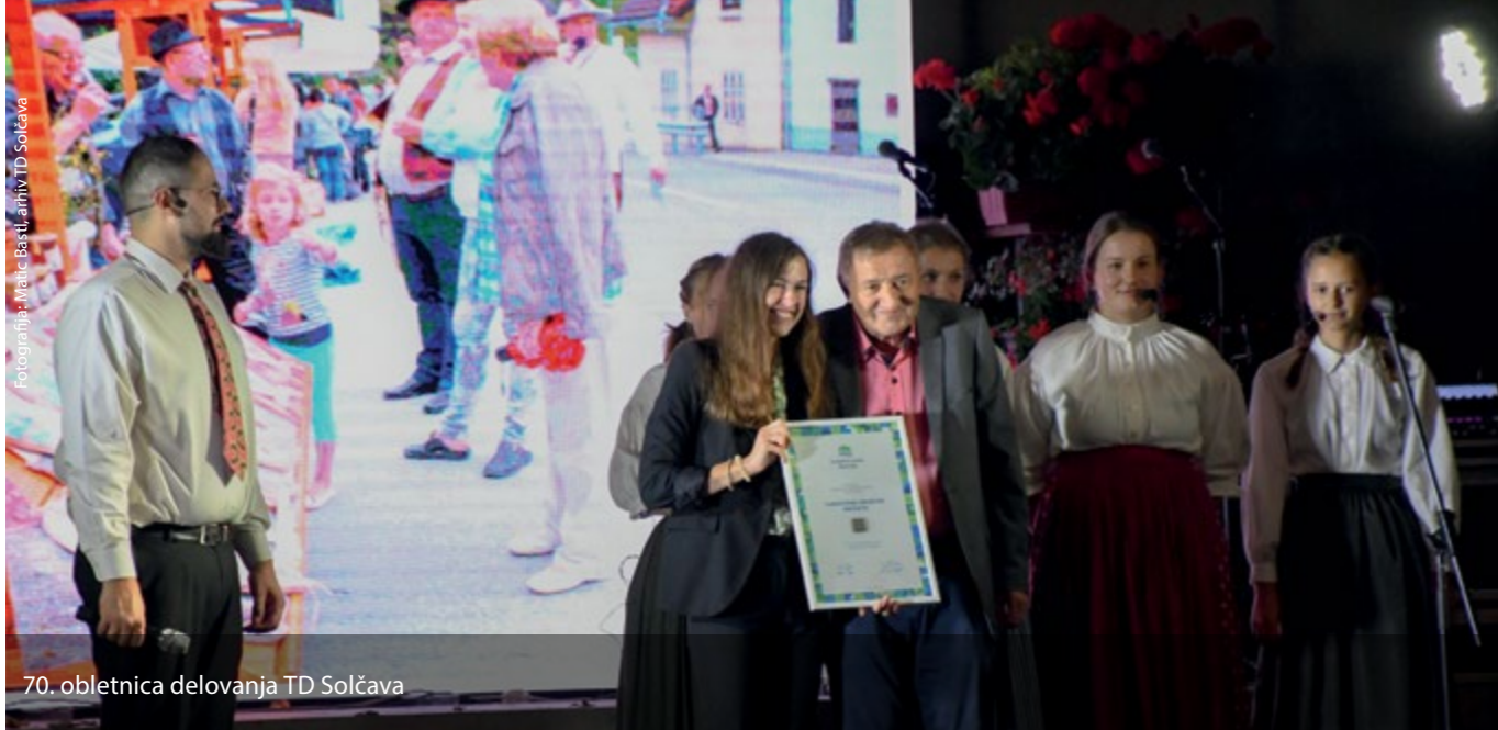
70. obletnica delovanja TD Solčava