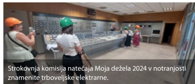
Strokovna komisija natečaja Moja dežela 2024 v notranjosti znamenite trboveljske elektrarne.

Vaš izlet se bo začel z obiskom znamenite trboveljske elektrarne in njenega presunljivega dimnika, ki s svojimi 360 metri višine velja za najvišji dimnik v Evropi. Zgradili so ga leta 1976, da bi zmanjšali onesnaženje zasavskih dolin, danes pa ponuja