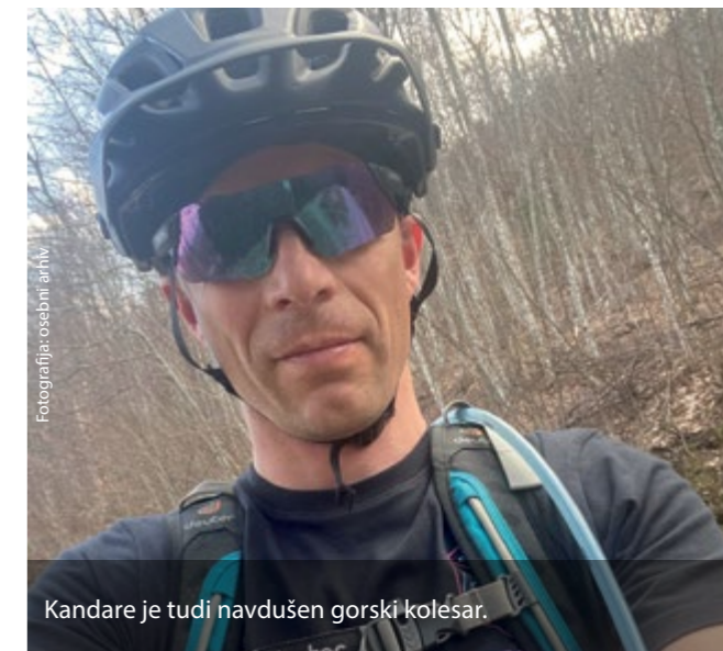
Kandare je tudi navdušen gorski kolesar.

Obstaja nekaj projektov, s katerimi se meri pritisk na samo pohodniško infrastrukturo oziroma planinsko infrastrukturo, spremlja se obisk in potem sprejema določene ukrepe.