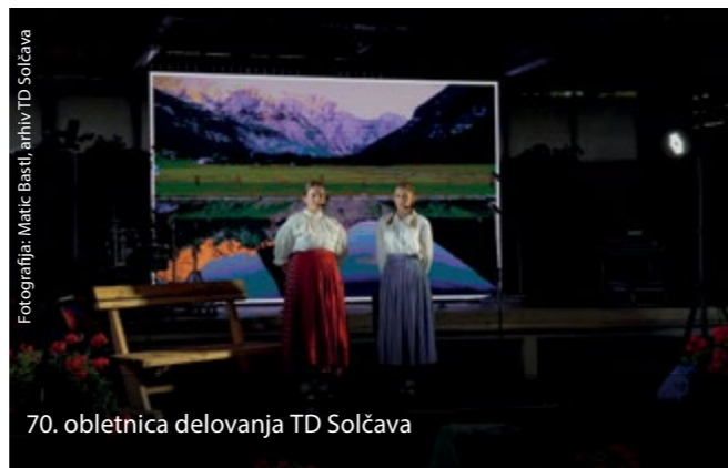
70. obletnica delovanja TD Solčava

V septembru, od 6. do 8., se bo odvijal že tradicionalni Festival ovčje volne Bicka. Organizirana bosta pohoda 's pastirjem na planino Strelavec po pastirsko malico' in sprehod po Bickini poti po vasi Solčava. Ogleдали si bomo lahko prikaz rokodelskih veščin, različne