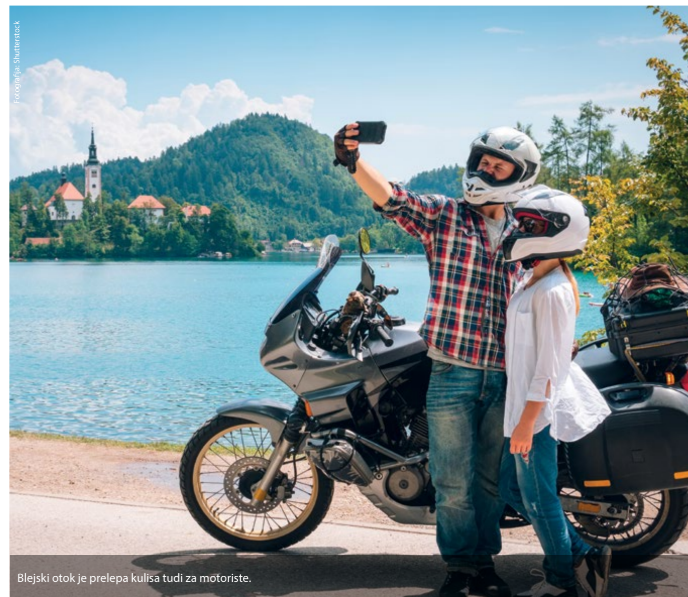
Blejski otok je prelepa kulisa tudi za motoriste.